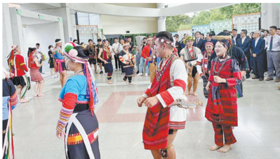
▲东华大学学生跳起少数民族舞蹈迎接大陆高校师生团。