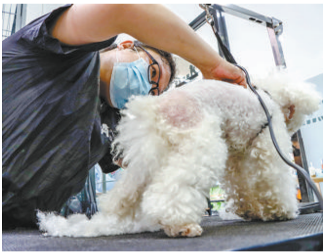
宠物店工作人员给宠物剃毛。

本报记者 罗子泓 实习生 张昊洋 大暑刚过，持续高温天气使不少市民纷纷将宠物送进宠物店——他们希望通过剃毛的方式，帮宠物降温。然而，也有人提出，小猫小狗的汗腺不发达，脱掉“大衣”并不能去除它们的暑热。如何科学地帮助宠物消暑？记者就此进行了采访。