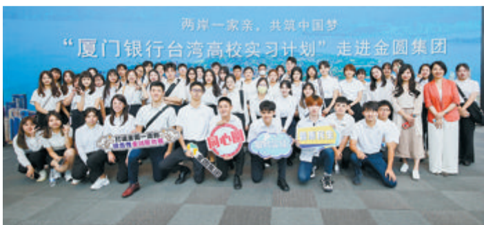
“厦门银行台湾高校实习计划”走进金圆集团。

该中心设立的全国首个农业碳汇交易平台,完成农业碳汇交易22万吨,并创新推动全国首个“农业碳汇交易平台创新数字人民币应用场景”落地;建设数字化绿色金融服务平台,入库绿色融资企业及项目226家,实现绿色项目碳减排效益70248.36吨;依托全国首个海洋碳汇交易平台完成全国首家海洋渔业碳汇交易,完成蓝碳交易13万吨,助力推动国家“双碳”目标与海洋经济融合发展。