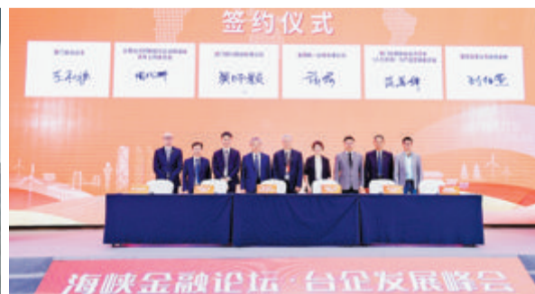
金圆集团成立“台港澳青年实习实训工作站”。