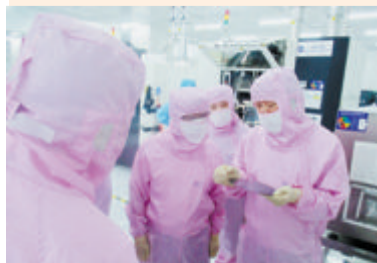
金圆集团深入云天半导体生产线上调研。

今年6月,金圆集团旗下金圆租赁与云天半导体签署3000万元的融资租赁合同,再度帮助企业盘活设备类资产,补充营运资金,降低融资成本。这也是厦门市技术创新基金项下新设立的融资租赁子基金完成的首笔项目签约。