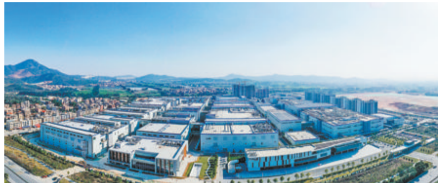
▲金圆集团通过产业直投助力链主企业培育。图为天马微电子8.6代项目建设现场