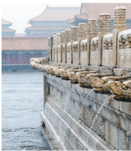
依靠精妙的排水系统,故宫建筑群在连日强降雨中安然无恙。

另外,记者从北京市防汛办获悉,截至7月31日12时,北京多条路段出现积水断路情况。此外,门头沟、房山还有几处塌方和小规模山洪等突发情况。其中门头沟区在7月31日上午的抢险巡查时,在河道中发现2人。发现时,2人均已失去生命体征。