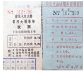
南京长江大桥和中山陵照相的收费票据。