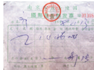
南京烈士陵园照相的收费票据。