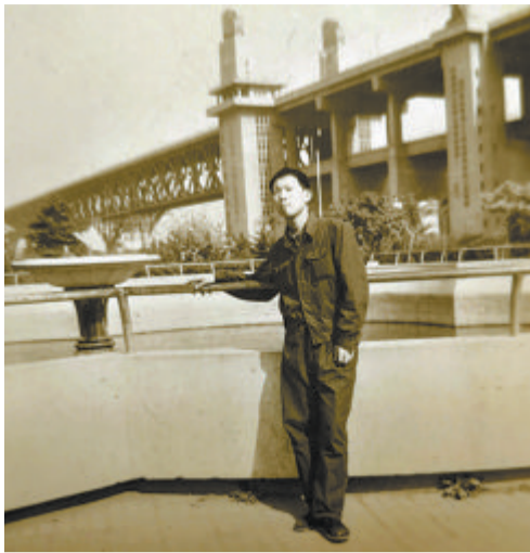
1978年4月13日,作者在南京长江大桥的留影。

妹妹和几位一同来培训的男工友在小门站迎接我。他们已经等了半个多小时。厂里一片漆黑,几位男工友把我带到他们的宿舍,那里正