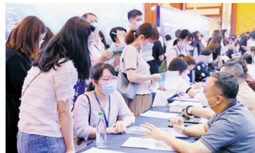
闽西南第四届暨厦门市第十九届校企合作对接活动现场。

接下来,市就业中心还将搭建离校未就业高校毕业生帮扶信息系统,对接“省毕业生就业创业公共服务平台”数据,与我市的精准就业帮扶工作进行结合,为离校未就业的高校毕业生提供全方位、多渠道、多领域的帮扶服务,为其提供全程跟踪服务和就业支持,解决其在求职过程中所面临的问题和困难,主动推送最适合、最新的招聘信息、就业创业政策信息,做到岗位找人、政策找人。