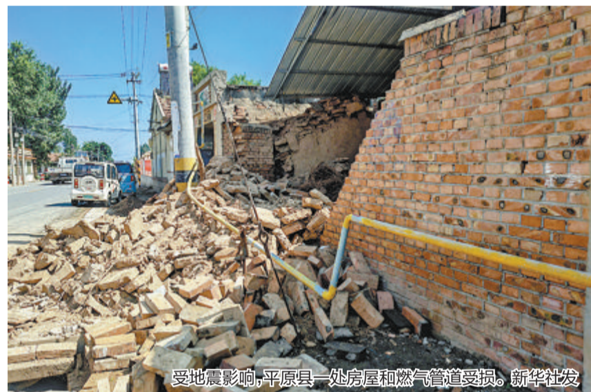
受地震影响,平原县一处房屋和燃气管道受损。

综合新华社电、央视新闻、中新网报道 中国地震台网测定,2023年8月6日2时33分在山东省德州市平原县发生5.5级地震(北纬37.16°,东经116.34°),震源深度10公里,震中位于平原县王打卦镇王打卦村附近。截至8月6日8时,共记录到余震59次,其中3.0级及以上余震1次,3.0级以下余震58次。