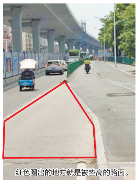
红色圈出的地方就是被垫高的路面。

文/图 本报记者 张玉榕 实习生 新泽 近日,有网友在网上发布了一则视频引发关注——在集美区安仁大道一处路段,路面一侧被垫高,形成“台阶”,有车主在夜路时“中招”,将车开了上去,并卡在了那里。有人不禁要问,为什么路面会这么设计?前日,记者对此进行了走访调查,并联系相关部门了解情况。