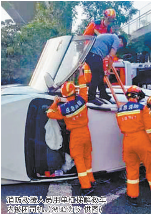
消防救援人员用单杠梯解救车内被困司机。

事故现场地处主干道,上班高峰期车流量较大,一组消防救援人员配合交警做好现场安全保障工作,另一组人员负责救援。消防救援人员爬上侧翻车辆,将副驾驶车门打开,随后,接过队友递来的单杠梯,将其架设在车内牢固处,用不到50秒的时间帮助被困司机脱困。司机脱困后,消防救援人员将现场移交交警处置。