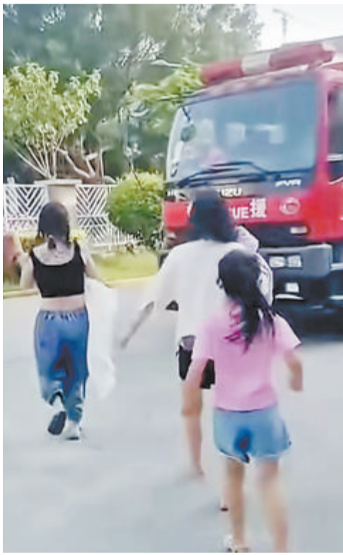
昏迷幼儿被送上消防车。(视频截图)