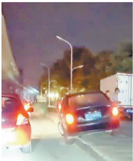
路过车辆被卡“台阶”。(网络视频截图)