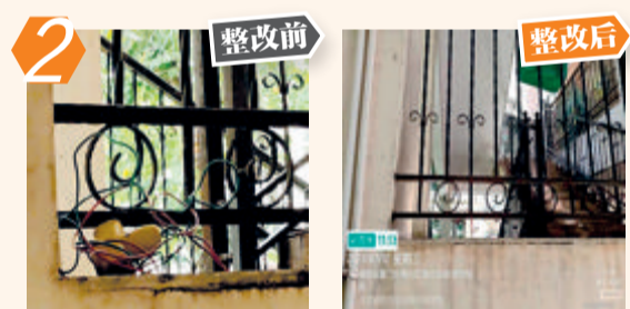
2 海沧区(都市恬园)沧林路314号线缆裸露问题。经现场核查,该问题已整改。