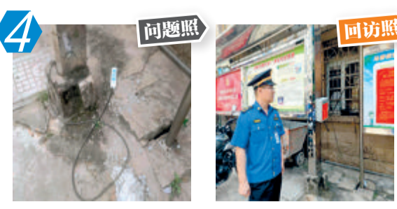
8 翔安区后亭社区宣传栏乱拉电线问题。经现场核查,该问题未整改。