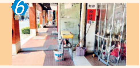
6 测评项目:主次干道 测评点位:翔安区新兴街 测评情况:该点位常态化市容管理有待提升,沿街路段存在跨店经营、乱拉电线、私设水龙头、乱摆放等问题;以及乱张贴,乱堆杂,非机动车乱停放、立面破损等,考评成绩72.00分。