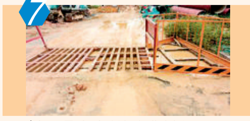
7 考评项目:扬尘防治(行业考评) 项目名称:马青路(石塘立交-翁厝立交段)提升改造工程 监管单位:市交通运输局 代建单位:厦门路桥工程投资发展有限公司 基本情况:该项目场内部分区域黄土裸露,洗车台未及时清理,地面浮土积尘较厚,现场存在严重扬尘污染问题。