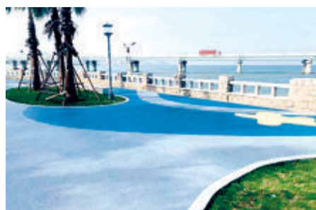
湖里区结合道路工程提升改造市容环境,将杏林大桥桥头卫生死角打造成干净整洁的休闲新去处。

今年5号台风“杜苏芮”给我市的市容环境造成了一定程度的影响,一些地方出现垃圾堆杂、倒伏的树木未及时处理等。全市各区、各部门应积极行动,加强市容卫生巡查力度,及时清理杂物、修复设施、扫除垃圾,全力做好台风过后的市容环境恢复工作,尽快恢复干净整洁的城市环境。