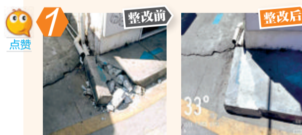
1 思明区曾厝垵120-101号道路破损问题。经现场核查,该问题已整改。

7月份,市城管办组织对上个月考评通报问题和前期行业考评曝光问题进行“回头看”。其中,抽查核上个月测评通报问题120件中,已整改112件,未整改或回潮8件,整改率93.30%。回访情况如下: