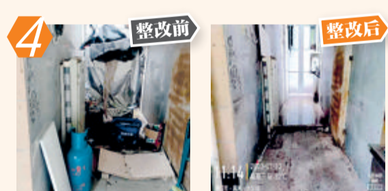
4 同安区美人山一里7-13号乱堆杂问题。经现场核查,该问题已整改。