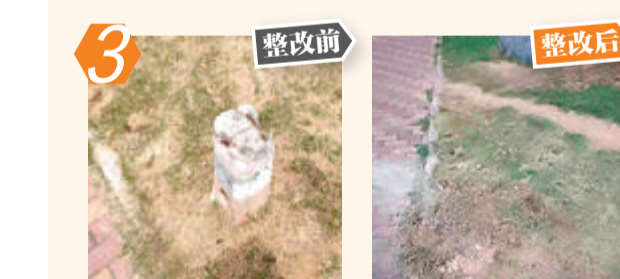
3 集美区大学康城二号大门口设施残留问题。经现场核查,该问题已整改。