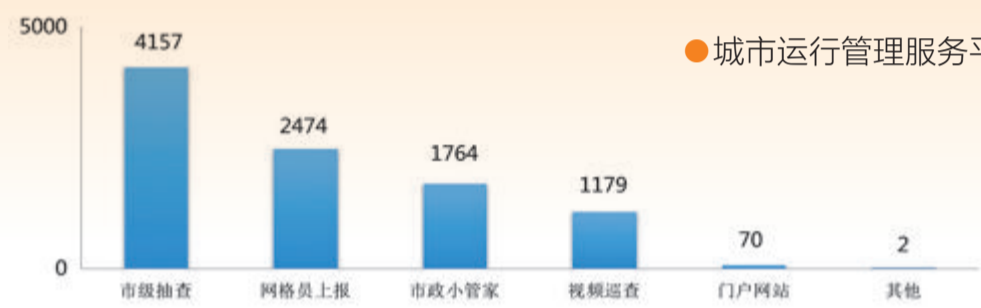
城市运行管理服务平台流转处置事(部)件问题受理情况(单位:件)

6月26日至7月25日,平台共受理事(部)件问题95841件,其中网格员自行处置问题86195件,经平台流转处置9646件。