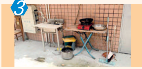
3 测评项目:小区 测评点位:同安区西池小区 测评情况:该点位日常市容管理有待加强,小区内秩序较为混乱,居民户外私设灶台,存有安全隐患;楼道内乱堆杂、乱摆放,乱张贴,线缆裸露、设施破损等问题较多;还存在不文明晾晒、非机动车乱停放现象,考评成绩68.00分。