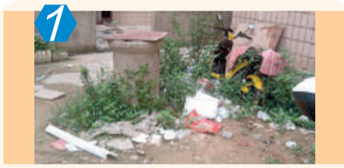
1 测评项目:城市社区(C类) 测评点位:同安区洪塘头社区 测评情况:该点位日常卫生保洁不到位,个别区域存有卫生死角;社区内还存在乱张贴、乱摆放、乱堆杂,乱排放污水等问题;周边沿街存有车辆乱停放、飞线充电、不文明晾晒、渣土堆积现象,考评成绩70.00分。