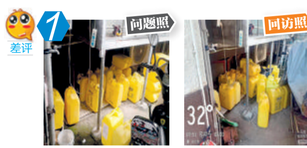
5 思明区盈翠里28号乱堆杂、乱拉电线问题。经现场核查,该问题未整改。