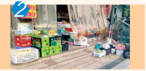
2 测评项目:城市社区(C类) 测评点位:思明区前埔社区 测评情况:该点位常态化市容管理存有不足,物品乱摆放问题较严重;社区内垃圾、烟蒂落地现象较突出;还存在飞线充电、车辆乱停放、不文明养宠,沿街跨店经营、乱排放废水等问题,考评成绩71.00分。