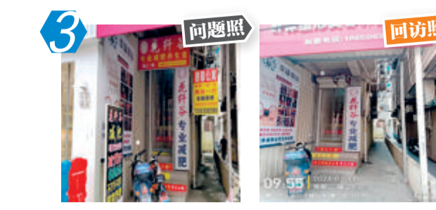
7 同安区官浔路花纤谷违规设置商业广告问题。经现场核查,该问题整改不彻底。