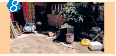
8 考评项目:农村生活垃圾治理和环境卫生管理(行业考评) 责任单位:同安区汀溪镇褒美村 考评情况:该村房前屋后堆杂情况普遍存在,还存在家禽散养问题;考评通报的问题整改情况较差,考评综合成绩83.37分。