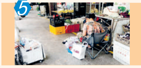
5 测评项目:背街小巷 测评点位:海沧区未来海岸步行街 测评情况:该点位日常市容管理不到位,秩序混乱,跨店经营、非机动车乱停放、物品乱摆放等问题较多;沿街路段存在飞线充电、乱张贴、违规设置商业广告等现象,考评成绩74.00分。