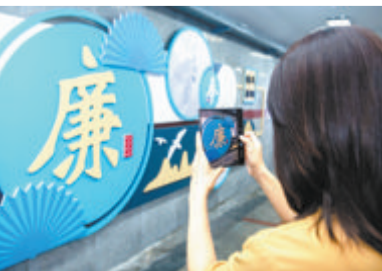
国贸中心廉洁文化通道墙面换上了廉洁家风的“新衣”,吸引市民拍摄。

通讯员 吴雪莹 谢小红 本报记者 林露虹 活泼可爱的IP“国贸”,朗朗上口的家家家训……近日,在厦门市纪委监委、市市政园林局指导下,“国贸中心廉洁文化通道”焕新升级。 该廉洁文化通道由国贸控股集团纪委、国贸地产纪委及国贸地产厦门公司党总支共同打造,位于国贸中心公交车站附近。“焕装”过后的通道,设有“廉”味十足的创意图文灯箱,传播廉洁文化。 此外,厦门市廉洁家风展国贸控股专场近期在银泰百货国贸中心店一楼同步展出。展览通过文字、图片、视频、书画等形式,展现了廉洁齐家的“厦门典故”,讲述廉洁家风的“国贸故事”,吸引了众多党员群众到场参观。