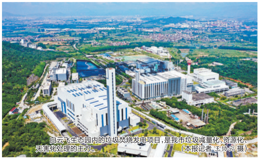
白云飞生态园内的垃圾焚烧发电项目,是我市垃圾减量化、资源化、无害化处理的主力。