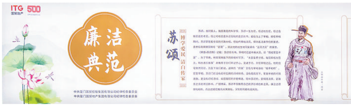
国贸中心廉洁文化通道融入厦门本土家风故事。

顺着国贸中心廉洁文化通道的台阶往下走,醒目的通道灯牌映入眼帘。进入通道,耳熟能详的廉洁古诗、富含廉洁寓意的漫画在通道两侧延伸开来,还有活泼可爱的国贸地产IP“国贸”一路“相随”,带领市民了解厦门本土家风故事。 据国贸地产介绍,通道全长约60米,两端是清晰的道路指引。此次焕新升级,公司纪委在不改变通道原始结构的基础上,对通道进行了墙面打磨、吊灯更换和地砖修补。同时结合廉洁家风宣传,为通道的墙面换上了廉洁家风的“新衣”。 “改造后的通道颜值提升了,今后我们走的不仅仅是一条地下通道,更是一条‘清风廉廊’。”一位居住在附近的市民感叹道。