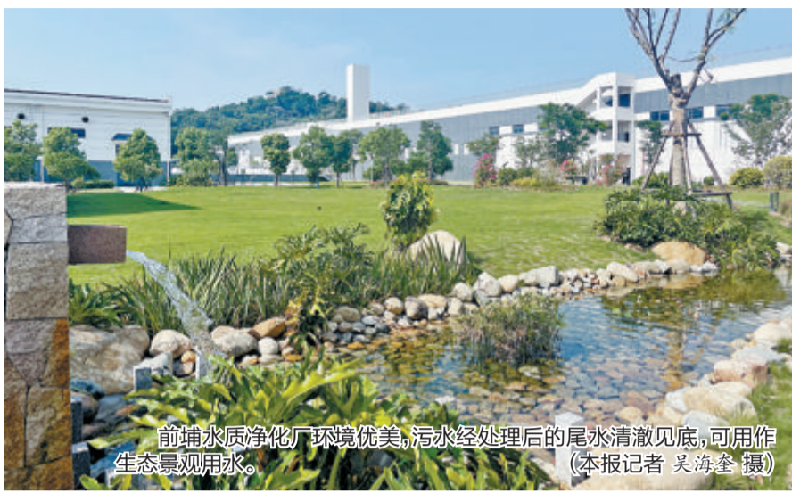
前埔水质净化厂环境优美,污水经处理后的尾水清澈见底,可用作生态景观用水。

本报记者 吴海奎 通讯员 洪扬扬 生活垃圾以清洁焚烧为主,产生电能输送到千家万户;污水经过深度净化,尾水实现再生利用;从通山连海的山海健康步道,到白鹭成群的筓筓湖,人与自然和谐共生……8月15日是首个全国生态日,本报记者近日实地探访厦门市政集团相关生产场所及生态环保项目,为您揭秘这家荣获厦门市生态文明工作先进集体的国有企业如何助推厦门加快绿色低碳循环发展、更高水平建设高颜值的生态花园之城。