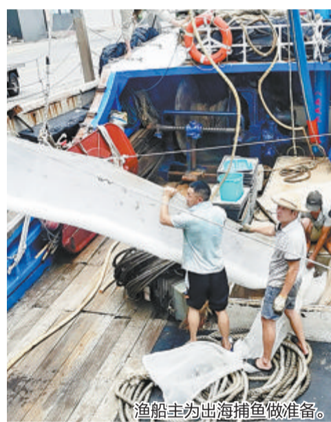
渔民为出海捕鱼做准备。

本报讯(文/图 记者 薛尧 实习生 张雨婷)厦门伏季休渔期明日结束,符合规定的渔船将从停泊点出发,前往近海或外海的渔场展开作业。昨日上午,厦门市渔港渔船管理处工作人员在高崎渔港码头对部分渔船进行全面检查。