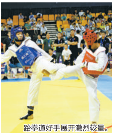
跆拳道好手展开激烈较量。

本报讯(文/图 记者 李翔宇)近日,2023年第七届“厦跆协会”杯(厦门)神州跆拳道馆联盟大赛在体育中心综合馆举行,来自厦门本土和省内外49支代表队约880名青少年好手聚鹭角逐、切磋交流。