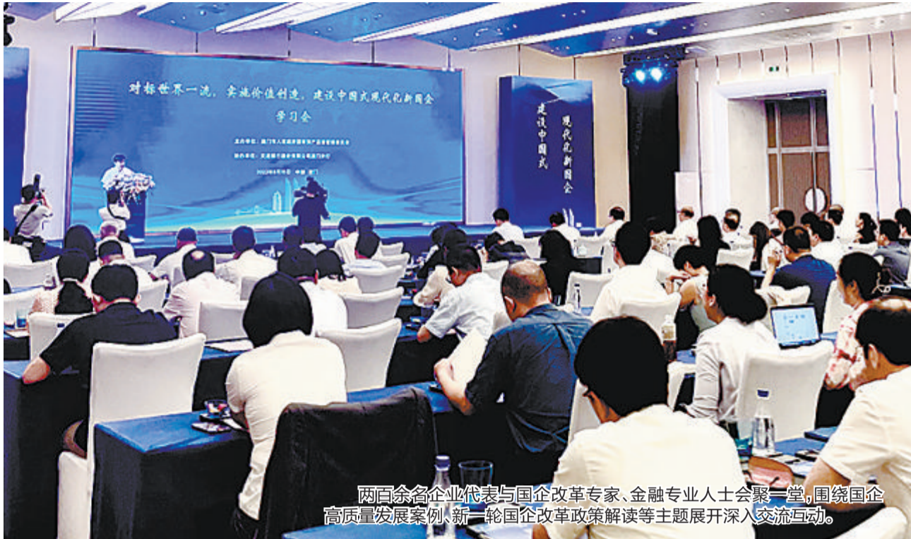
两百余名企业代表与国企改革专家、金融专业人士齐聚一堂，围绕国企高质量发展案例、新一轮国企改革政策解读等主题展开深入交流互动。

文/本报记者 苏丽娜 图/实习生 马娟 8月15日，由市国资委主办的以“对标世界一流，实施价值创造，建设中国式现代化新国企”为主题的国企改革深化提升行动学习会在厦举行，市属国企及重要子企业、上市公司主要负责人，企业分管财务相关负责人等两百余位代表，与国企改革、国企经营专家，以及金融行业专业人士齐聚一堂，围绕国企高质量发展案例、新一轮国企改革政策解读、金融创新推动国企转型升级举措等主题展开交流、互动，满满“干货”为进一步优化国有资本布局、深化国有企业改革、推动国有企业创新驱动高质量发展领航指向，赋能加油。