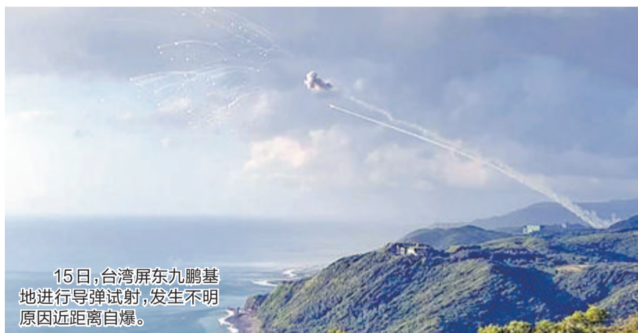
15日,台湾屏东九鹏基地进行导弹试射,发生不明原因近距离自爆。

九鹏基地在本月3日进行弹药销毁作业时曾发生燃烧事故,造成4人受伤,其中2人伤势严重,分别为全身85%、50%烧烫伤。