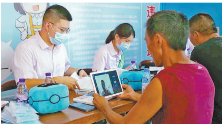
厦门农行走进工地,为新市民群体提供上门服务。

值得一提的是,为了让优质金融服务直达村(居)民,厦门农行拓宽服务半径,开设“金穗惠农通”服务点,实现岛外区域全覆盖,打通金融服务乡村“最后一公里”。