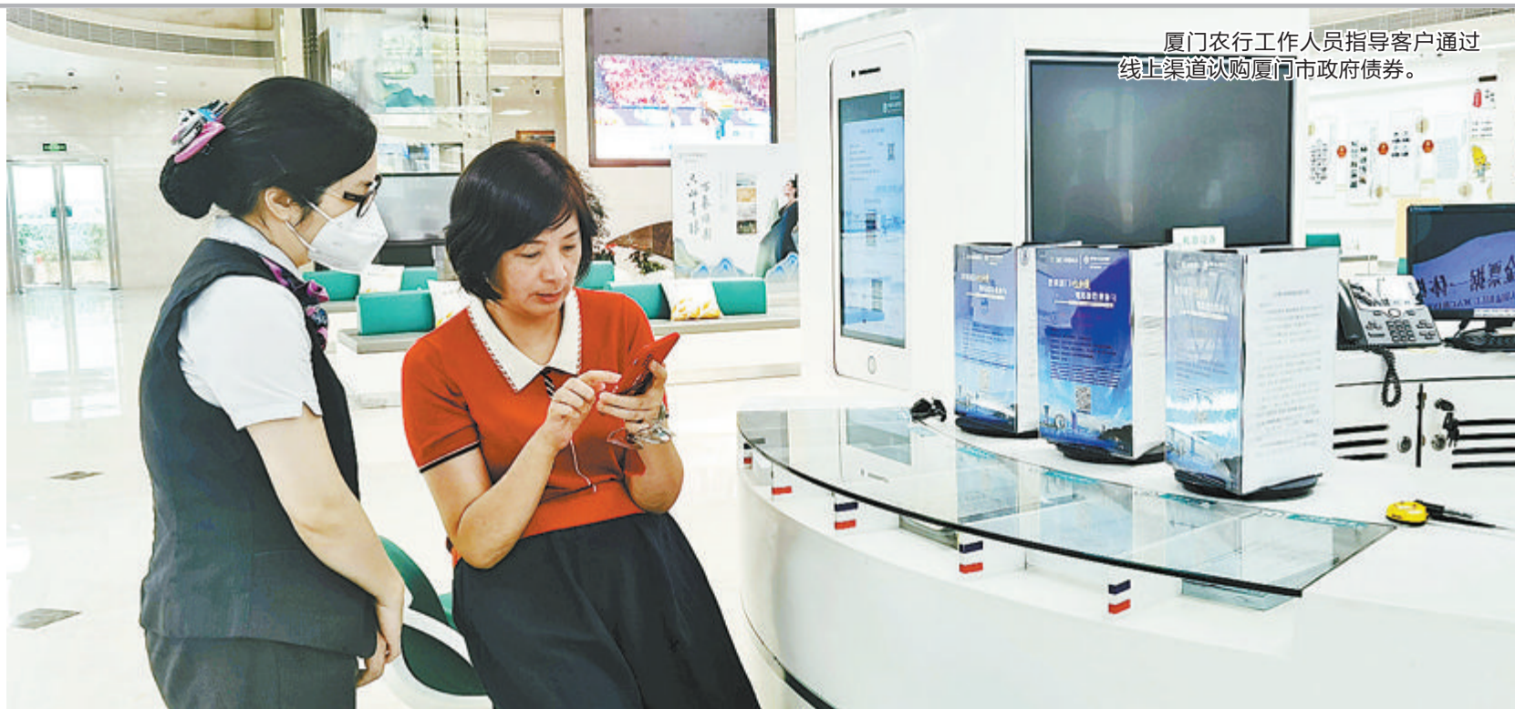
厦门农行工作人员指导客户通过线上渠道认购厦门市政府债券。