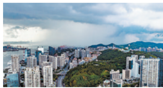
昨日午后,我市出现阴雨天气。

本报讯(记者 朱道衡 通讯员 刘珏)闽南民谣云“风静闷热,雷雨必震裂”,昨天厦门午间闷热,再次酝酿出午后雷雨。气象部门预测,未来几天,厦门天气依然不太稳定,云层较多,午后阵雨、雷雨多发,市民要注意加强防范。