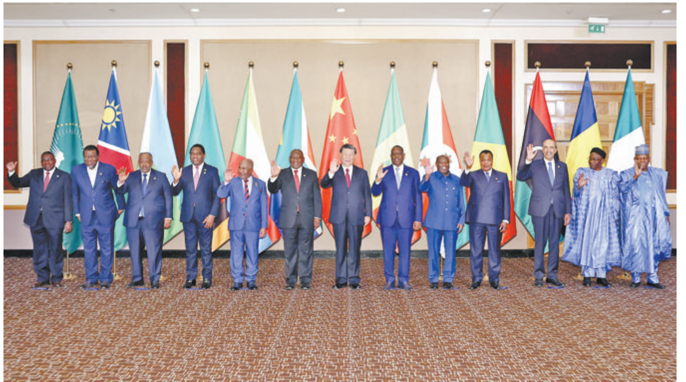
▲国家主席习近平和南非总统拉马福萨在约翰内斯堡共同主持中非领导人对话会。这是会前集体合影。