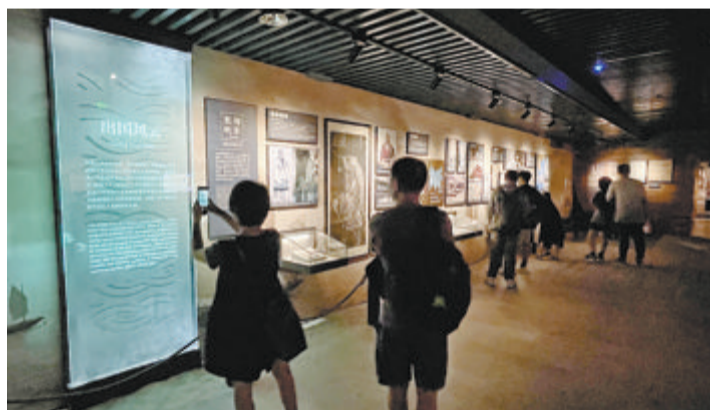
市民游客在博物馆观看展览。

文/图 本报记者 薛尧 见习生 苏衍洲 实习生 张雨婷 今年暑假,全国不少地方博物馆游火热,游客量大增。厦门也不例外——鼓浪屿风琴博物馆馆长方思特介绍,今年7月份,风琴博物馆参观者超3万人,较去年有了较大幅度提升。数据显示,暑假以来,厦门市博物馆观众总量35.58万人次,日均近7000人次,是去年同期的3倍。华侨博物院7月参观人数为21313,8月参观人数预计将达25000。