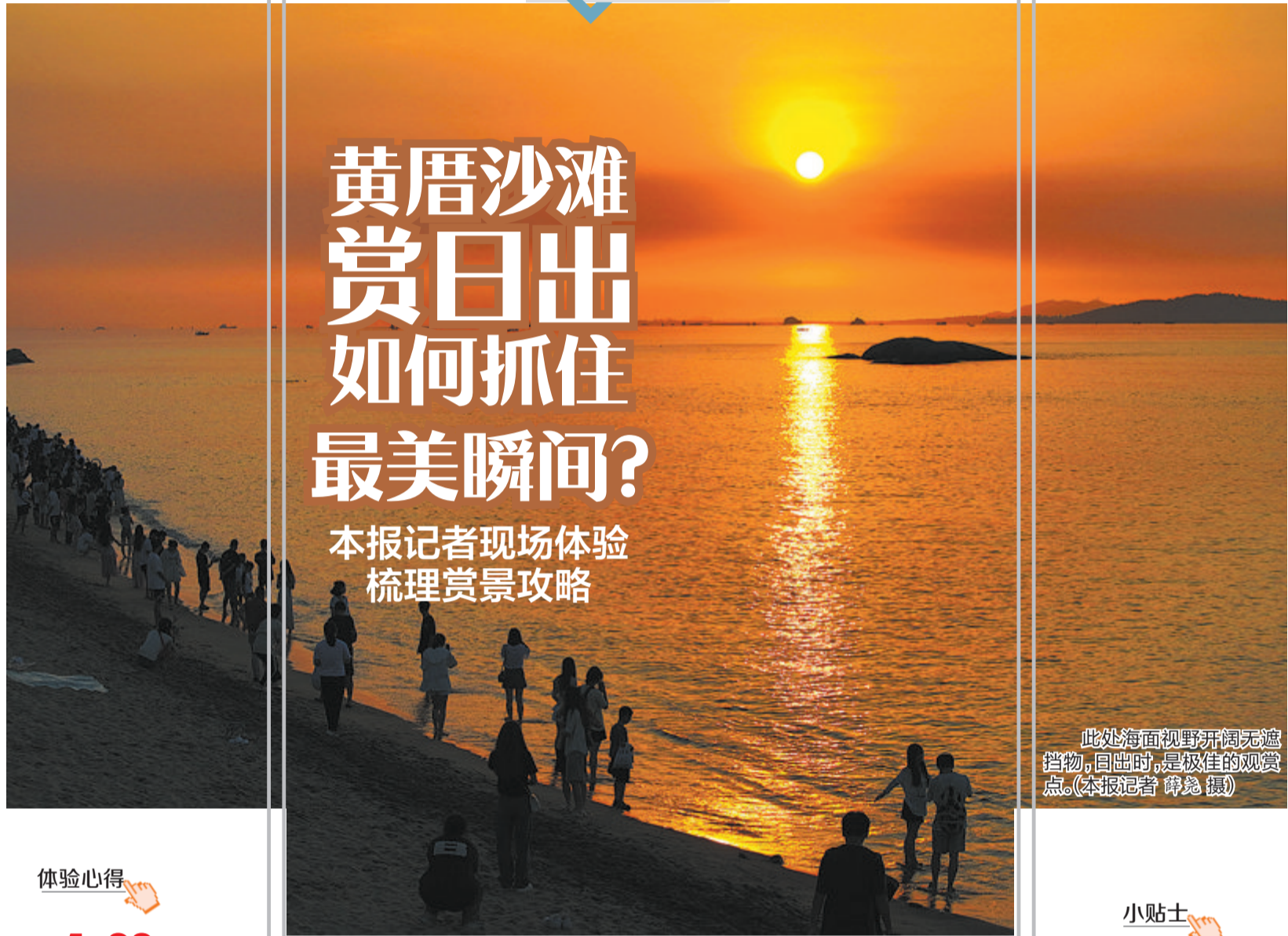
此处海面视野开阔无遮挡物,日出时,是最佳的观赏点。