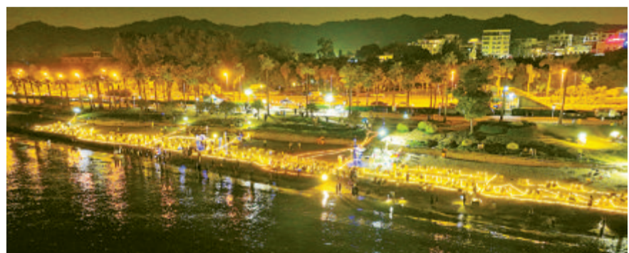
凌晨4时,黄厝沙滩“星光点点”,虽在夜间,来到这里的市民游客依然有很多游玩项目可选择。

“一、二、三,干杯!”在沙滩的另一边,记者的视线被另一群年轻人吸引,经了解,记者得知他们是一群高三毕业生,再过几天就要奔赴全国各地为各自的人生梦想奋斗,当天相约一起来到海边等日出。“过去三年一起拼搏过的岁月,必将成为我们未来人生中最美好的回忆。”记者从他们的眼中看到对未来的期望。