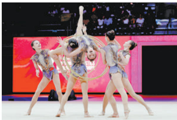
中国队五朵金花合力拿下5圈单项金牌。

新华社北京8月28日电 据中国体操协会28日凌晨消息,在西班牙举办的第40届世界艺术体操锦标赛中,中国艺术体操队以1金2银的成绩,实现世锦赛参赛历史性突破。