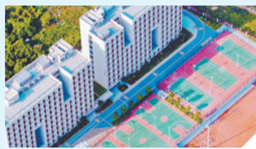
厦门六中同安校区

“名校跨岛”又有新进展:厦门二中集美校区、厦门六中同安校区投用。“百校焕新”绝大部分可完工:第一批“百校焕新”共涉及57所学校120个项目。