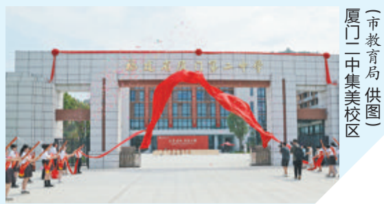
厦门二中集美校区

新增8.53万个中小学幼儿园学位,历来最多;10所新建普高投用,史上最多,今年的普高录取率从去年的58.6%提高到今年的62.1%。