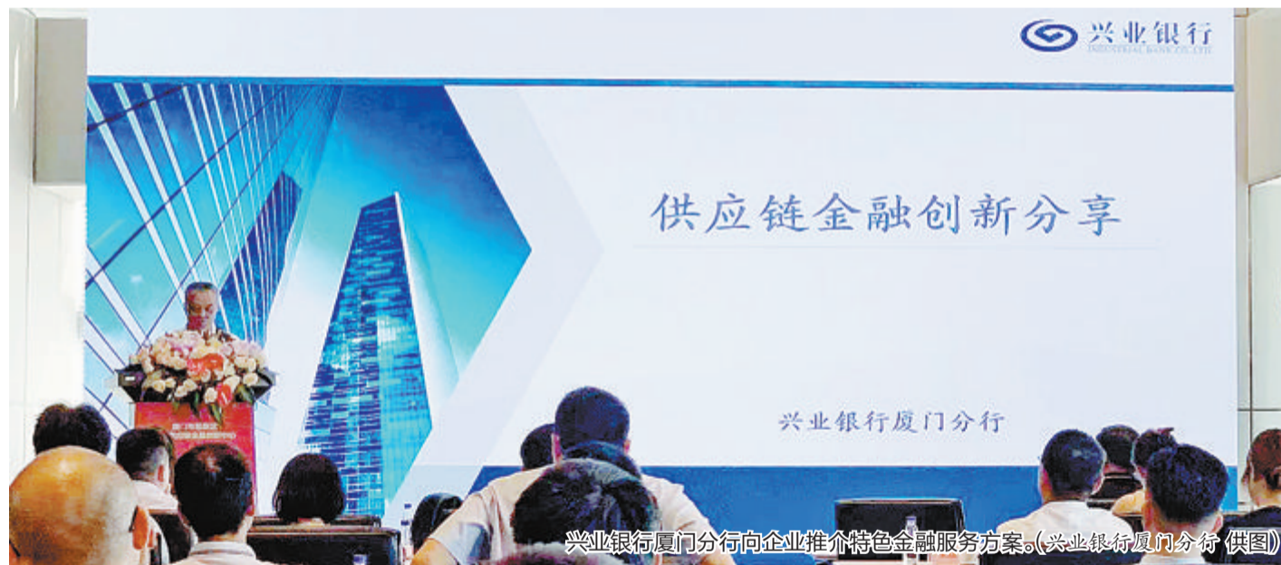
兴业银行厦门分行向企业推介特色金融服务方案。

今年是全面贯彻党的二十大精神开局之年,也是兴业银行成立35周年。在总行的指导下,兴业银行厦门分行当前正紧扣省市政策和总行战略方向,立足本地市场和企业发展需求,优化跨境业务投融资管理、支持贸易新业态跨境结算,持续推进数字化经营与跨境结算双提升,助推民营经济提质增效、转型升级,为厦门外贸高质量发展、打造更优秀的营商环境贡献金融力量。