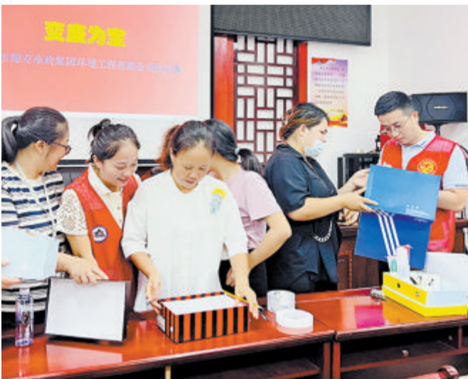
公司党员、入党积极分子教授居民变废为宝的小技巧。

本报讯(文/图 记者 邵凌丰 通讯员 陈晓露)昨日下午,翔安市政集团环境工程有限公司党支部组织党员干部职工前往共建的航星社区开展主题党日活动。