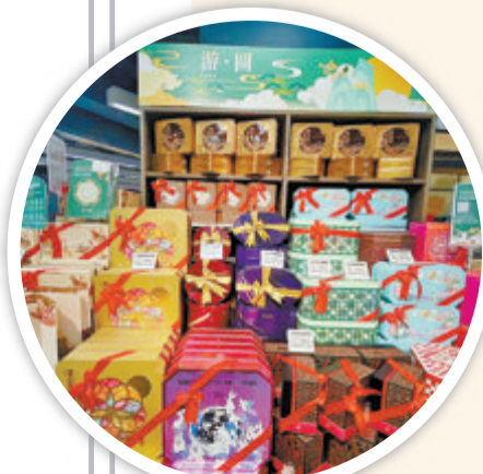
已经在超市上架。不同包装风格的月饼