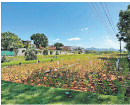
生态河道湿地内敷设补水管道,种植水生植物,让流经这里的农田退水得到进一步净化。