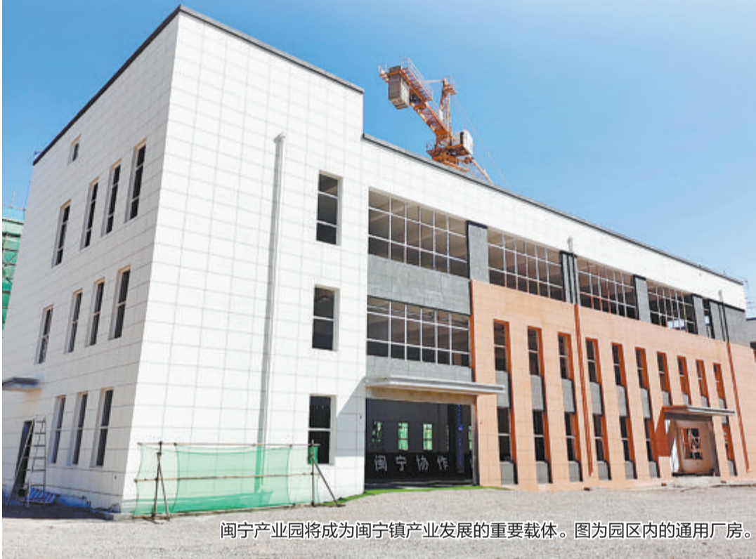
闽宁产业园将成为闽宁镇产业发展的重要载体。图为园区内的通用厂房。

福建和宁夏，曾经很远，现在很近。今天，厦门第十二批援宁工作队成员结束了两年的挂职任务，新一批工作队队员也启程前往宁夏。这些跨越山海、超越时空的往来，都将成为山海协作的生动见证。近日，本报记者远赴宁夏，实地感受东西部协作的成效。