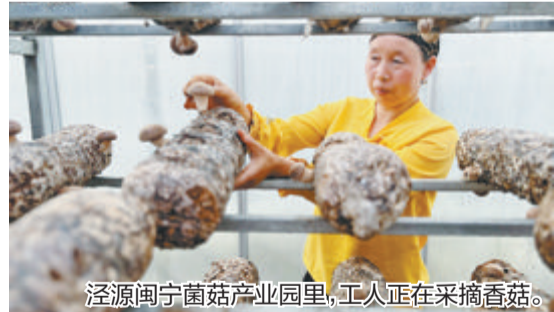
泾源闽宁菌菇产业园里，工人正在采摘香菇。

“泾源菌菇”撑起了联动带农的“致富伞”。在福建省援宁工作队的支持下，国内食用菌权威科研机构长期在泾源县开展技术指导，福建农林大学林占熹教授团队在泾源县设立工作站，一批科研项目落地转化，成功实现了宁夏夏季香菇、羊肚菌规模化量产，黑木耳大田及林下人工种植双量产。