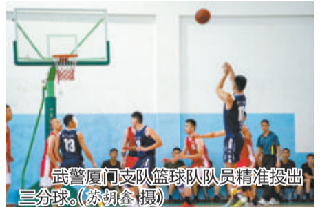
武警厦门支队篮球队队员精准投出三分球。

本报讯(记者 蔡镇全 通讯员 蔡伟艺 苏胡鑫)带球过人、妙传队友、精准投篮……近日,在武警福建总队2023年度“强军杯”篮球决赛现场,在仅剩4秒结束比赛的关键时刻,武警厦门支队篮球队3罚3中成功追平比分,历经2轮加时赛后,以118:115的微弱优势成功打败武警漳州支队篮球队,首次斩获“强军杯”篮球赛冠军。为期两个多月的“现象级军营体育嘉年华”——“强军杯”篮球赛正式落幕。