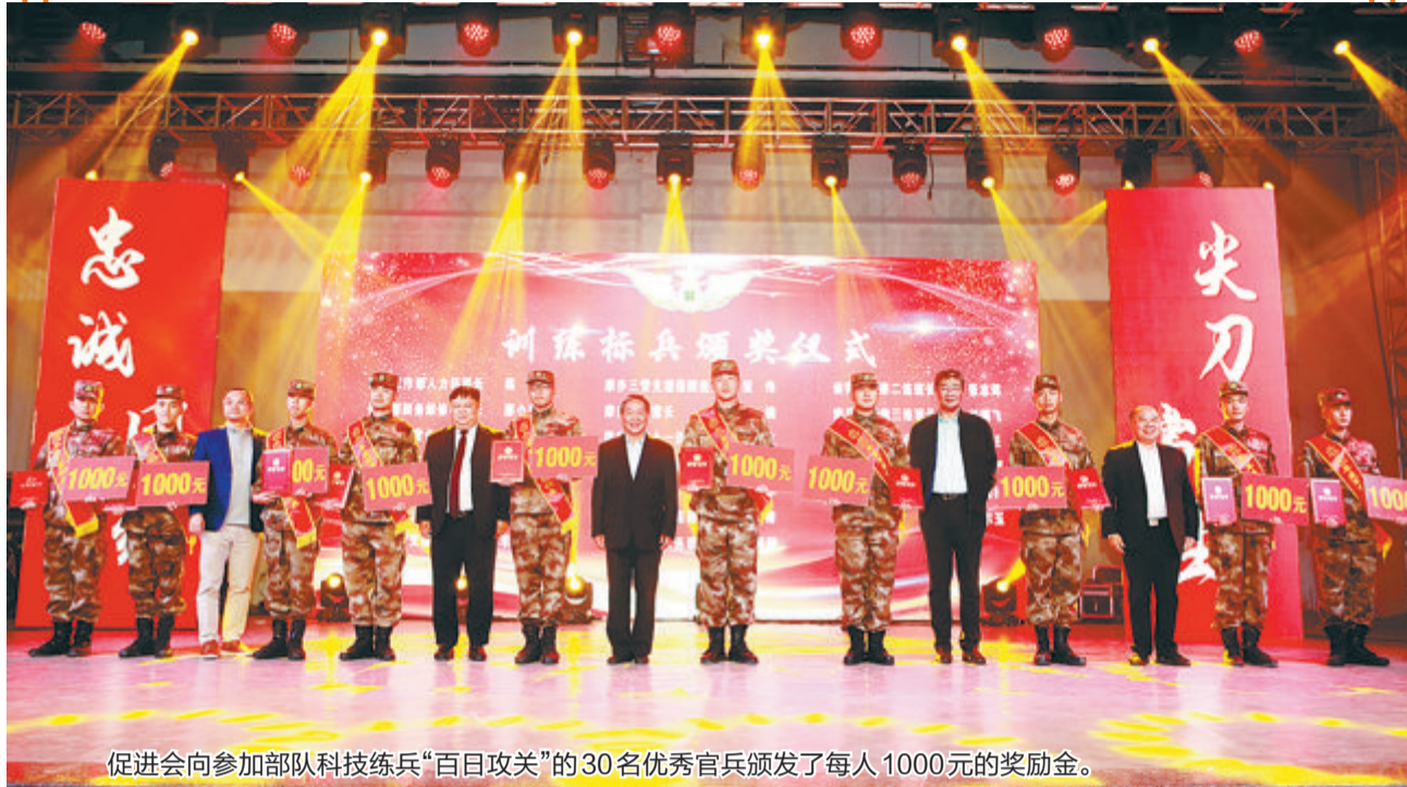
促进会向参加部队科技练兵“百日攻关”的30名优秀官兵颁发了每人1000元的奖励金。

市爱国拥军促进会着力打造文化拥军、科技拥军、法律拥军、教育拥军和关爱老兵五大品牌