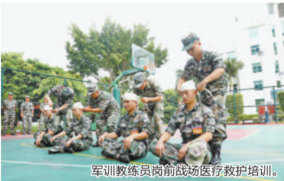
军训教练员岗前战场医疗救护培训。

本报讯(文/图 通讯员 黄彦奕 吴诗雨)为提高军训教官队伍整体素质,提升学生军训质量效益,近日,翔安区人武部积极组织学生军事技能训练教官进行岗前培训,旨在培养一批会讲、会做、会教、会做思想工作的“四会”教练员。