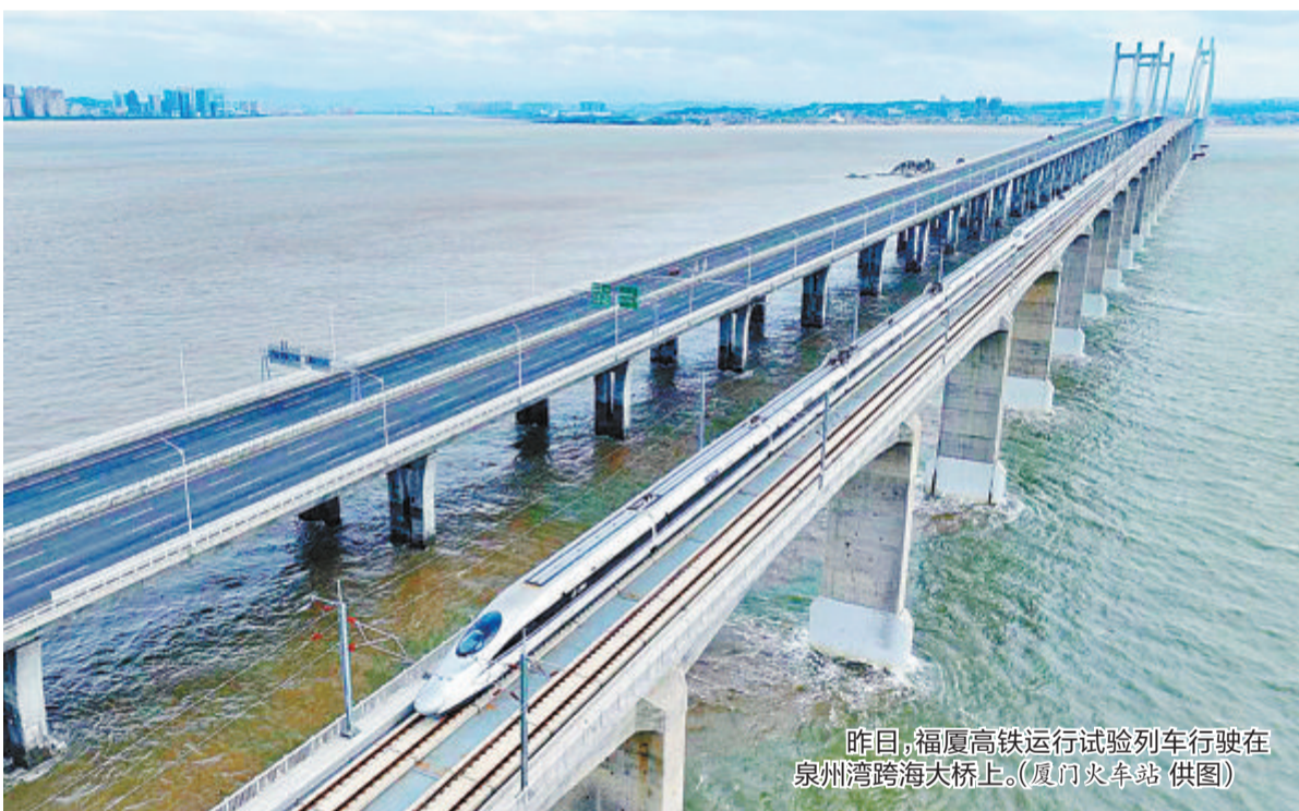
昨日，福厦高铁运行试验列车行驶在泉州湾跨海大桥上。