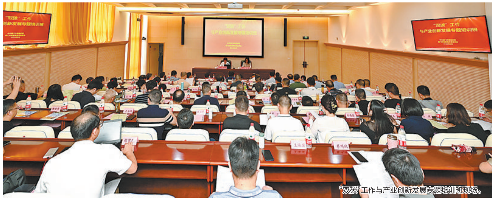
“双碳”工作与产业创新发展专题培训班现场。