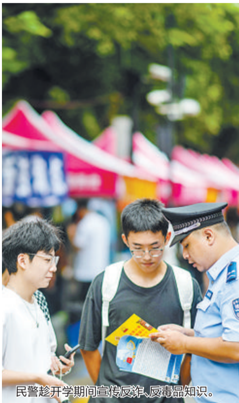
民警趁开学期间宣传反诈、反毒品知识。

文/本报记者 罗子泓 张玉榕 实习生 金琛 厦门大学昨日开始迎新，13000多名2023级新生陆续到校报到，其中，包含本科新生5594人，研究生新生7835人。 今年的迎新，不论对于学生、家长还是校方来说都可谓特别——一方面，这是时隔三年，家长首次陪着孩子进校报到；另一方面，迎新日碰上台风天，校方也根据实际情况，灵活调整了部分工作。