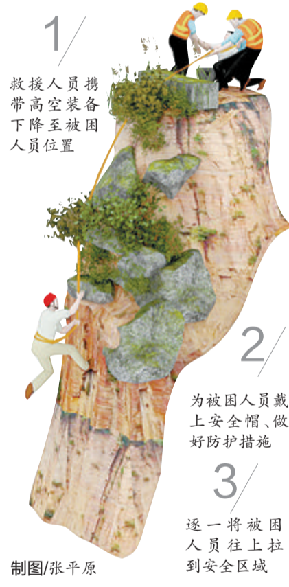
救援人员携高空装备下降至被困人员位置

本报讯(文/图 记者 罗子泓 房舒 通讯员 陈雅 陈寒)两名驴友前往同安区汀溪镇半岭村杉际内爬山。不料，涨水的溪流，已晚的天色，成了他们下山的“拦路虎”——两人被困陡峭湿滑的半山腰，进退维谷。9月3日晚7点多，接到报警的汀溪派出所民警、大同消防救援站消防队员、星晖救援队和北极星救援队队员赶往现场。 民警与被困人员沟通得知，他们被困的地点处于坡度约70度的峭壁上，周边的高低落差近10米。救援人员介绍，由于杉际内植被茂盛，无通行道路，加之前期降雨导致灌木丛湿滑，夜间上下山存在一定危险性等因素，此次救援难度较大。 在护林员的带领下，救援人员经1小时搜寻，最终找到了两名驴友。询问得知无人受伤后，救援人员利用高空绳索制作提拉系统。随后，3名救援人员携带高空装备下降至被困人员位置，为他们戴上安全帽、做好防护措施，与地面救援人员协作，逐一将驴友往上拉到安全区域，随后带他们下山。 据驴友讲述，他们是徒步旅游爱好者。事发当天，俩人将车停在半岭村，从杉际内的山腰处向上爬。结果，爬着爬着，前方没了去路。想要折返时，俩人发现，来时路上的溪流已开始涨水，天色渐暗，更不敢贸然行动。无奈至极，他们拨通了报警电话。