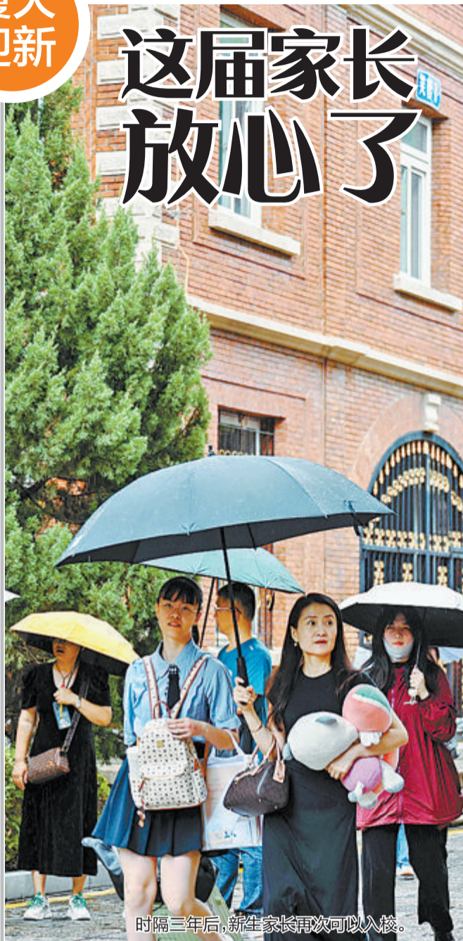
时隔三年后，新生家长再次可以入校。

文/本报记者 罗子泓 张玉榕 实习生 金琛 图/本报记者 林铭鸿 厦门大学昨日开始迎新，13000多名2023级新生陆续到校报到，其中，包含本科新生5594人，研究生新生7835人。 今年的迎新，不论对于学生、家长还是校方来说都可谓特别——一方面，这是时隔三年，家长首次陪着孩子进校报到；另一方面，迎新日碰上台风天，校方也根据实际情况，灵活调整了部分工作。