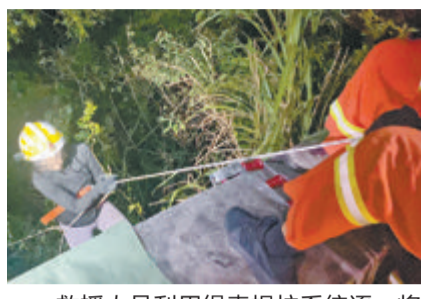
救援人员利用绳索提拉系统逐一将被困人员营救至安全区域。

本报讯(文/图 记者 罗子泓 房舒 通讯员 陈雅 陈寒)两名驴友前往同安区汀溪镇半岭村杉际内爬山。不料，涨水的溪流，已晚的天色，成了他们下山的“拦路虎”——两人被困陡峭湿滑的半山腰，进退维谷。9月3日晚7点多，接到报警的汀溪派出所民警、大同消防救援站消防队员、星晖救援队和北极星救援队队员赶往现场。 民警与被困人员沟通得知，他们被困的地点处于坡度约70度的峭壁上，周边的高低落差近10米。救援人员介绍，由于杉际内植被茂盛，无通行道路，加之前期降雨导致灌木丛湿滑，夜间上下山存在一定危险性等因素，此次救援难度较大。 在护林员的带领下，救援人员经1小时搜寻，最终找到了两名驴友。询问得知无人受伤后，救援人员利用高空绳索制作提拉系统。随后，3名救援人员携带高空装备下降至被困人员位置，为他们戴上安全帽、做好防护措施，与地面救援人员协作，逐一将驴友往上拉到安全区域，随后带他们下山。 据驴友讲述，他们是徒步旅游爱好者。事发当天，俩人将车停在半岭村，从杉际内的山腰处向上爬。结果，爬着爬着，前方没了去路。想要折返时，俩人发现，来时路上的溪流已开始涨水，天色渐暗，更不敢贸然行动。无奈至极，他们拨通了报警电话。