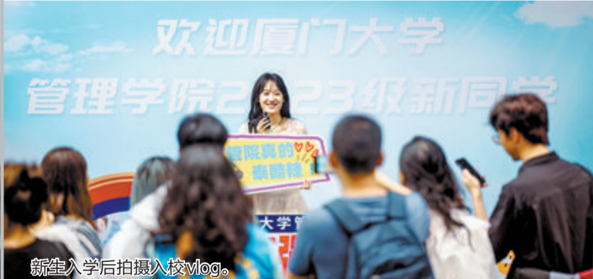
新生入学后拍摄入校Vlog。

车站、校门口、校内等，为新生及其家长提供引导、行李运输、材料派发等服务。 校方介绍，迎新后，学校将集中开展新生入学教育，以及军训。今年的军训时间将从往年的两周延长至三周，一些传统军训项目依然保留，比如，学生们将以思明区“一国两制”沙滩标志为折返点，进行10公里以上的新生拉练等，学校希望以此来传承弘扬优良的校风、学风。