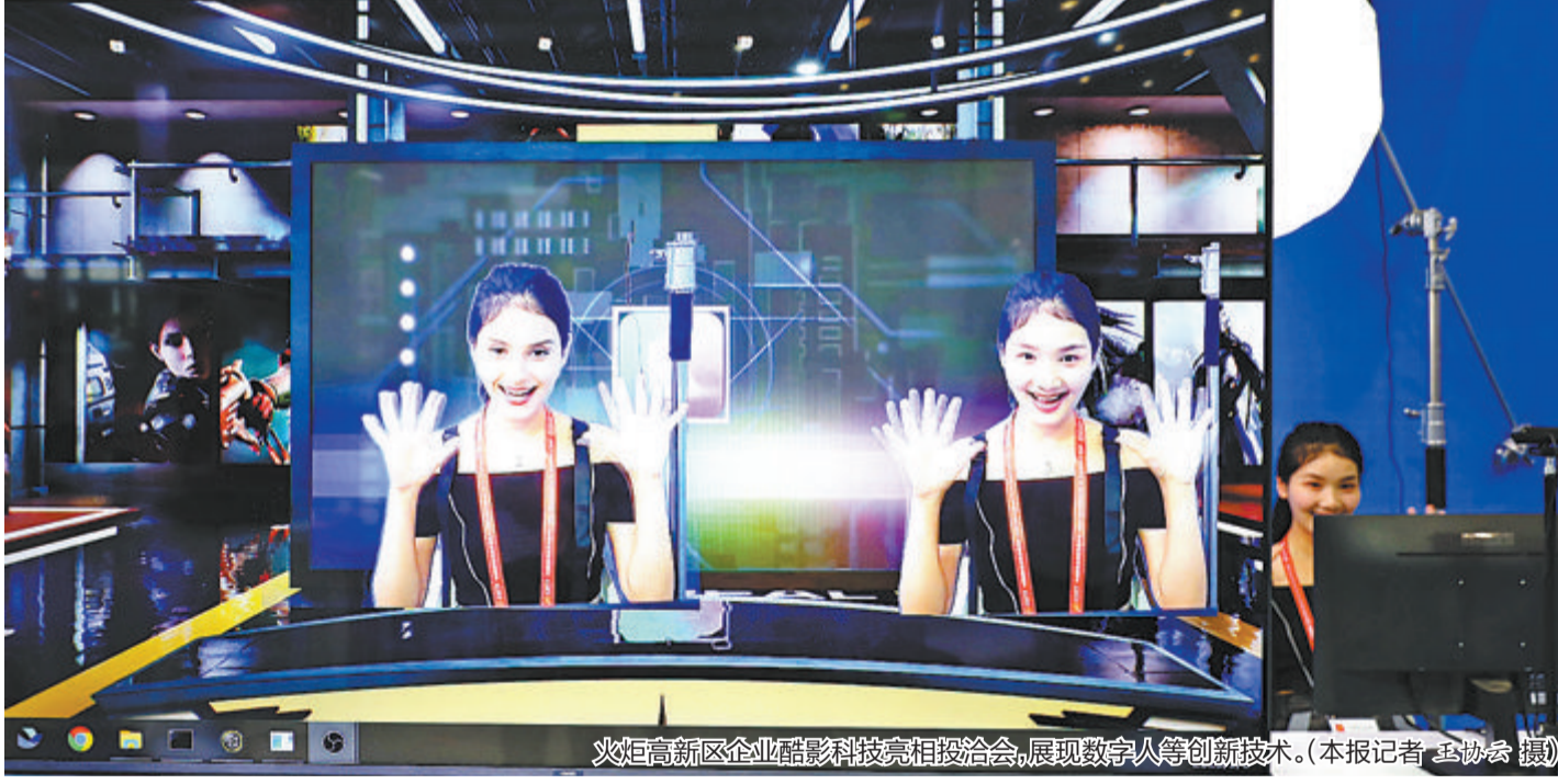
火炬高新区企业酷影科技亮相投洽会,展现数字人等创新技术。

与此同时,汉印电子、新声科技、视诚科技、酷影科技、鹭岛氢能等多家火炬高新区专精特新企业、高新技术企业代表携拳头产品亮相投洽会,通过实物展示、视频介绍、AR等多种形式,生动展现火炬高新区科技创新的硬核实力。