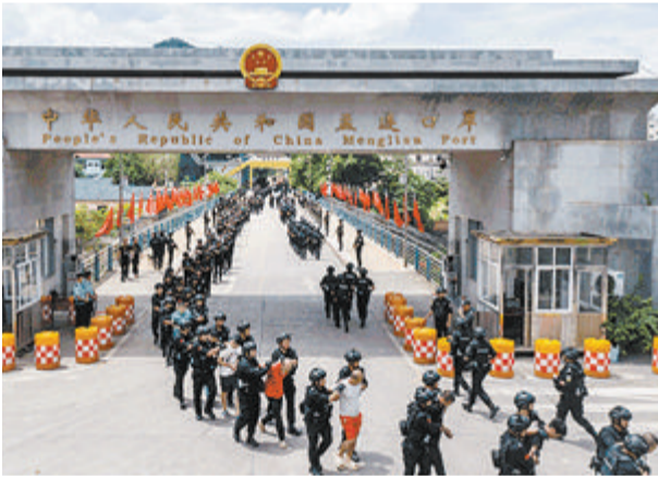
▲ 缅北涉诈犯罪嫌疑人从缅甸移交我方。 ▼ 我国公安机关严阵以待，准备接收犯罪嫌疑人。