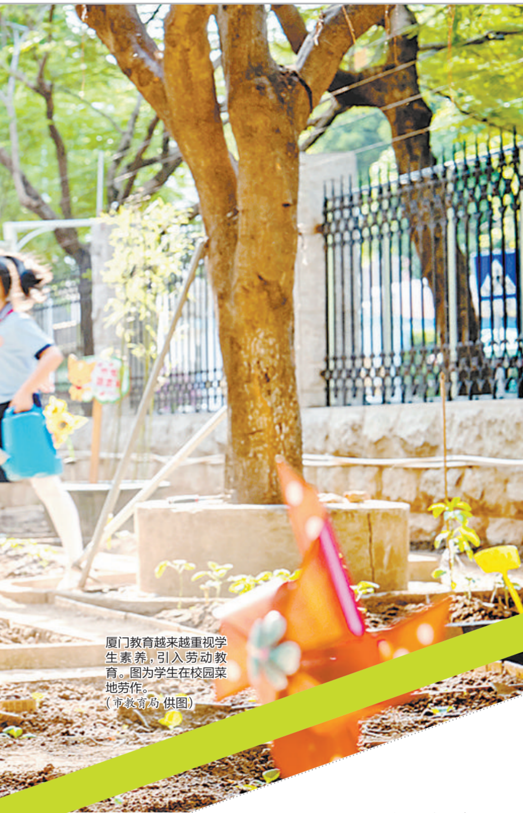
厦门教育越来越重视学生素养,引入劳动教育。图为学生在校园菜地劳作。