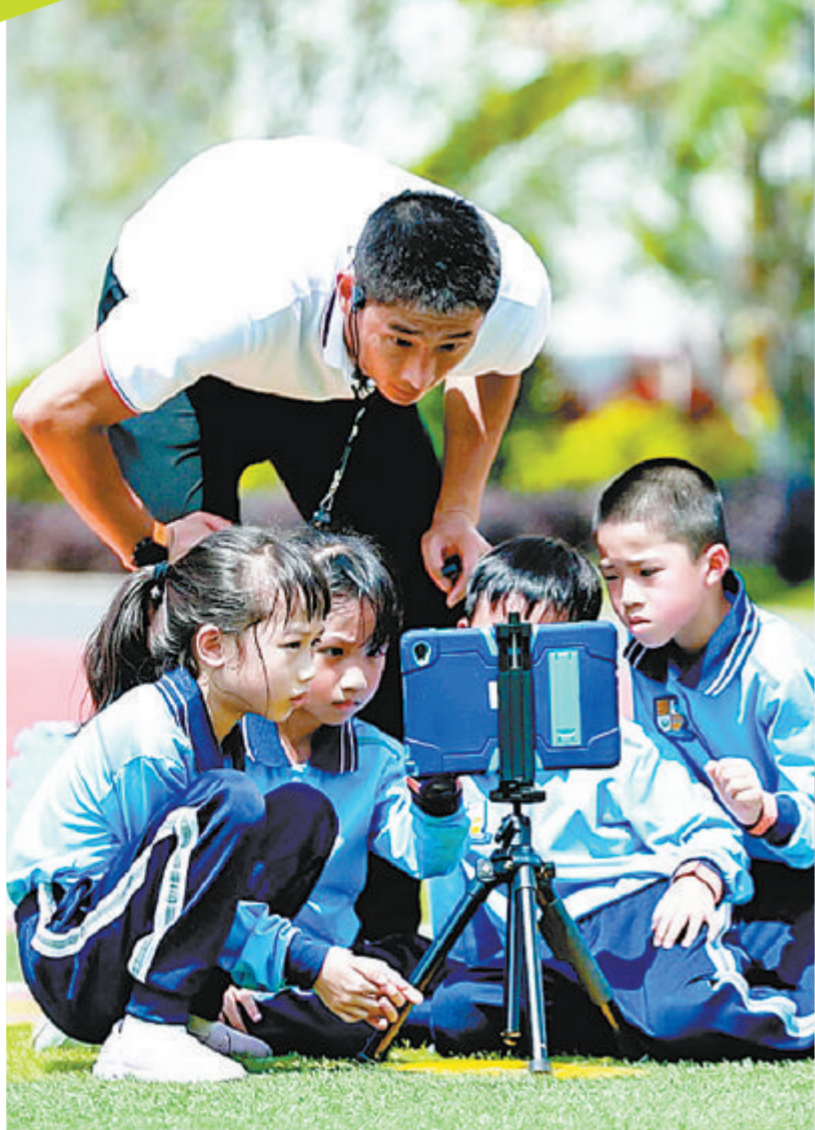
作为“国家级信息化教学实验区”,思明区用技术赋能发展。

当然,教育发展顾问不是听几节课了事,这只是开始。思明区教师进修学校介绍,合作期是三年,顾问们还会有更多入校“把脉”、诊断等。至于校长们希望的跟岗学习,“都会安排上”。