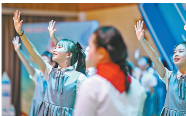
莲前小学的孩子们在开学演出中展现出快乐的笑脸。

思明区教育局说,目前,思明区共有13个教育共同体,覆盖59所校园。两个批次侧重点也有所不同:首批以厦外附小、厦门二实小和莲前小学为核心的共同体,侧重点更多在于老校带新校,品牌校带发展校。第二批共同体中,除了核心校外,不少伙伴校也是“百姓心中的好学校”。