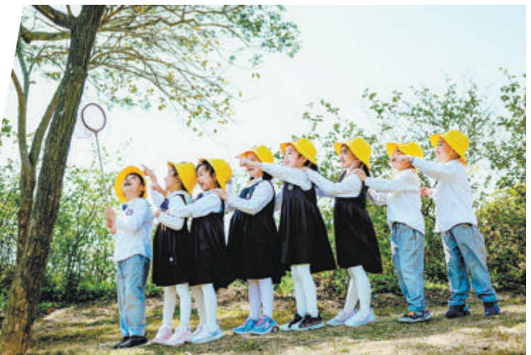
思明区德信美劳“五育”并举促进学生全面发展。图为外出郊游的小朋友。