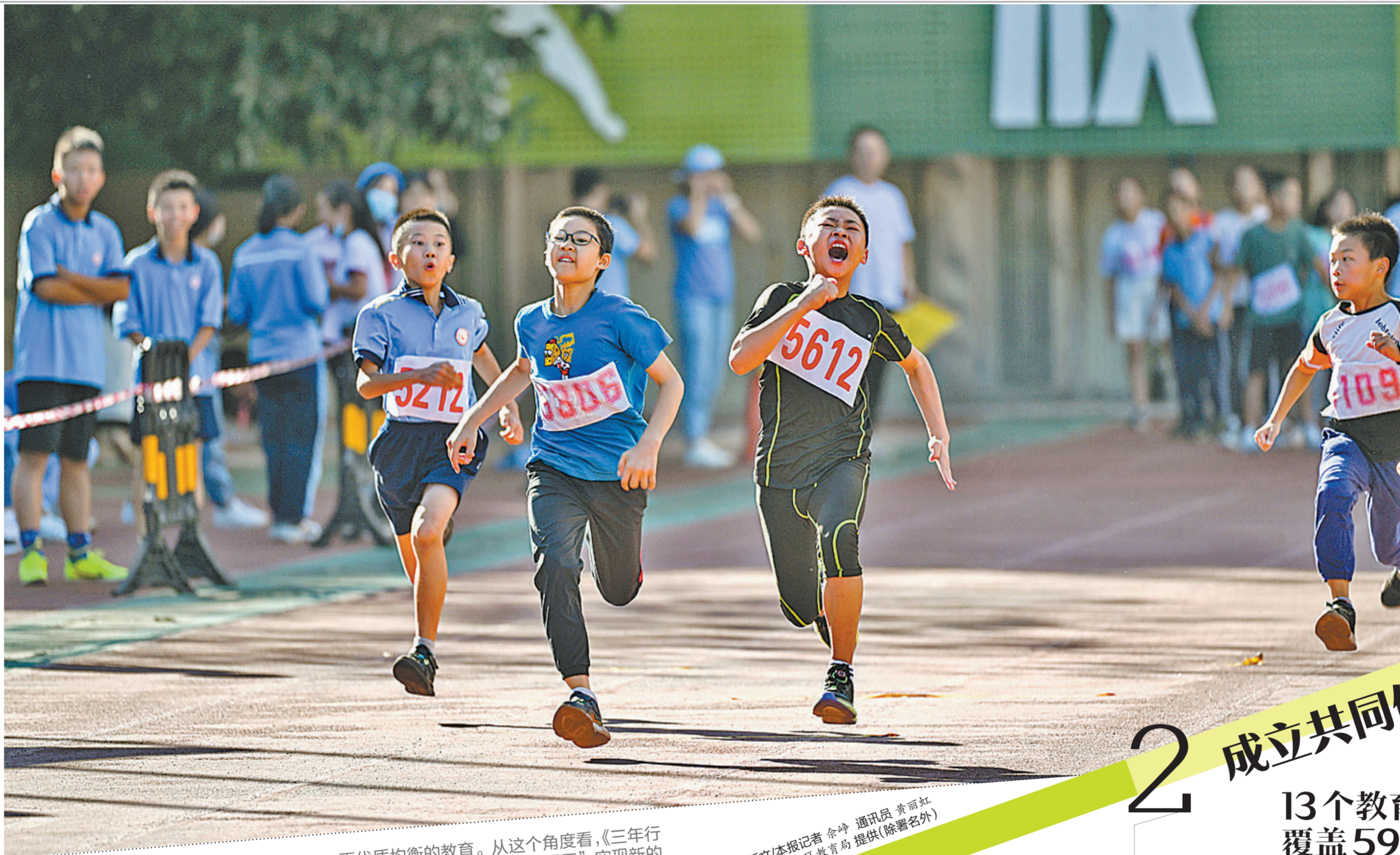
一直以来,思明教育从未停止寻求自我突破。图为校园中奔跑的孩子。