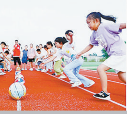
丰富的课程设置,让孩子们更好“好学”。

并不是很多人知道,今年,湖里教育藏着一个全省首个——今年4月,湖里区在全省率先接受“全国义务教育优质均衡发展区”省级督导评估,顺利通过验收并申报国家督导评估认定。 这也意味着,目前,湖里区不仅是厦门唯一,也是福建省唯一一个获准申报“全国义务教育优质均衡发展区”的县(市、区)。 “全国义务教育优质均衡发展区”的意义在于,它要求教育不仅要均衡,还要优质,要创建“公平而有质量的教育”。从评价指标上看,相比之前“基本均衡区”和“教育强区”,“优质均衡发展区”更上几层楼。 “优质均衡”是今后义务教育的发展方向,意思是努力让家门口学校都成为好学校。这次,湖里区冲在最前面,她是全省“第一等”。 当然,从申报“全国义务教育优质均衡发展区”评估认定,到被认定,还有更硬的骨头要“啃”。不过,具体来谈,创建的过程更重要——湖里区“全国义务教育优质均衡发展区”创建之路,是“壮腰”之路,不管结果如何,最终受益的是老百姓。 今年教师节,我们从几个关键词,来看看一年来湖里教育的成绩,这是湖里10325名教职员工的奋斗成果。