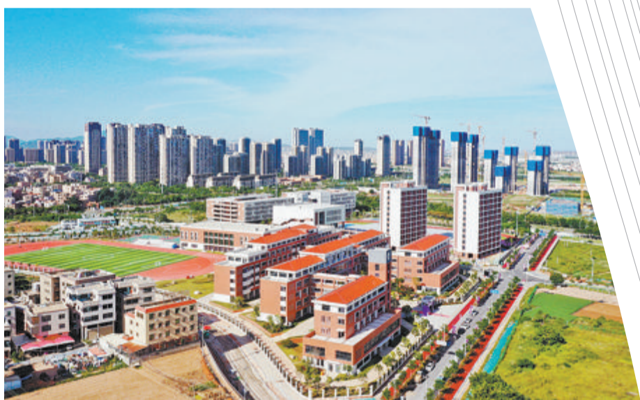
翔安中学