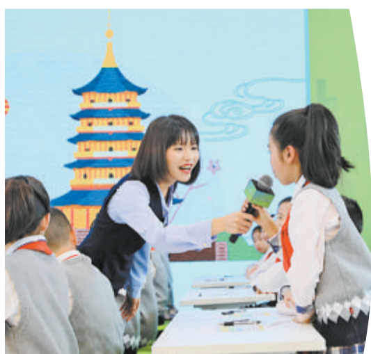
金山小学第四届“3+N”教育论坛。