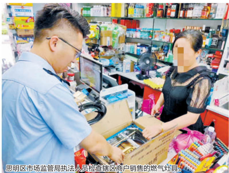
思明区市场监管局执法人员检查辖区商户销售的燃气灶具。

据了解，为全面落实市场监管领域燃气安全监管责任，此次市场监管部门计划用3个月左右的时间，在全市范围内开展集中攻坚，全面排查整治城镇燃气风险隐患，切实消除突出风险隐患；再用半年左右时间，巩固提升集中攻坚成效，全面完成对排查出风险隐患的整治，构建燃气气瓶和燃气器具隐患排查治理工作机制；到2024年底前，建立起以“严进、严管、重罚”为特点的我市市场监管领域城镇燃气安全监管长效机制，守牢安全底线。