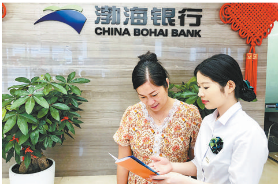
渤海银行厦门自贸区分行积极向客户宣传跨境人民币首办户政策。