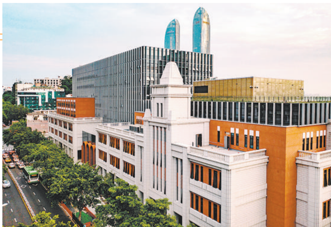
▲思明区青少年宫新宫位于思明南路与成功大道交叉口东南侧。