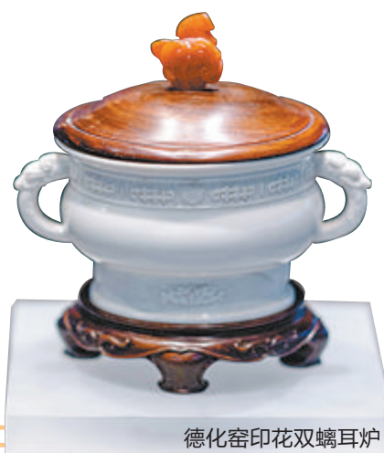
德化窑印花双螭耳炉