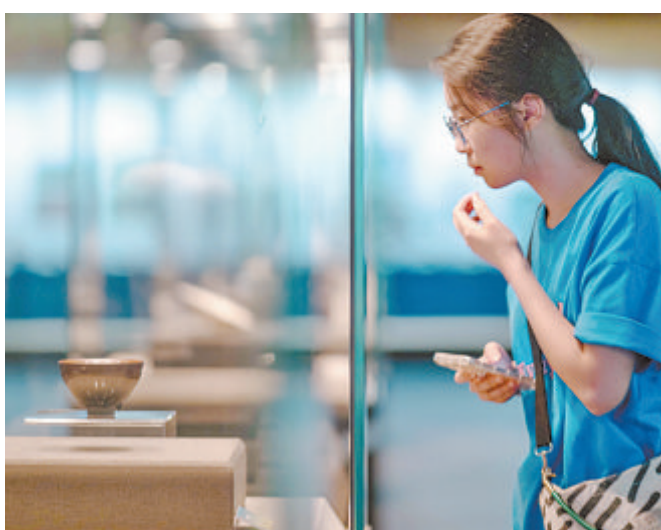
▲市民在博物馆欣赏展品。

“闽瓷双璧 交相辉映——福建黑白瓷器展”15日在厦门市博物馆开展。展览将持续至11月30日。