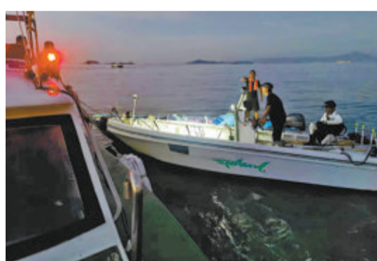
海警对相撞的船只展开救援。

本报讯(记者 杨震瑜 通讯员 霍施龙)16日4时34分,厦门海警局接到警情称,土屿附近海域疑似有两艘船舶发生碰撞,一艘船舶正在下沉,情况危急,请求海警部门前往救助。接警后,指挥中心立即派遣附近海域巡逻执法艇前往事发海域开展救援,现场发现有人员受伤,所幸伤者并无生命危险。