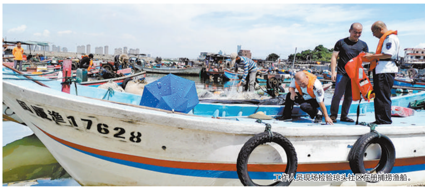
工作人员现场检验琼头社区在册捕捞渔船。

验、证书发放、政策性渔业保险、通信终端检测、渔业安全专题宣传等“一站式”服务,业务在渔村办理,检验在码头开展、问题在一线解决,便利渔民群众,助力金秋鱼满舱。