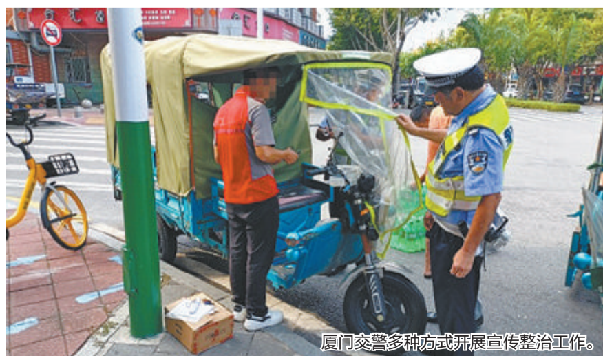
厦门交警多种方式开展宣传整治工作。

厦门交警提醒,驾乘车辆要严格遵守相关法律法规、安全文明出行。饮酒之后请自觉选择其他交通方式,千万不要酒后驾驶,这不仅是对自己的生命安全负责,更是对他人生命的尊重。