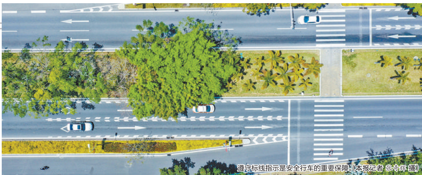
遵守标线指示是安全行车的重要保障。

9月14日晚,桥隧交警大队快速路中队民警成功救助一名突发疾病的男子。接到警情后,快速路中队迅速派警并联系120前往现场。民警林绍宽赶到现场后,发现三辆车停在导流线上,地上躺着一名男子,旁边有两名热心群众。经询问得知,该男子因身体不适,停好车下车后便倒在地上抽搐。民警见状迅速维持好现场交通秩序,引导车辆及时避让,确保男子安全,直至该男子被家属和120救护车带至中医院检查。