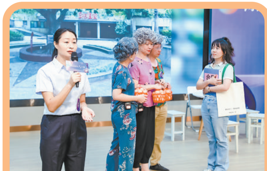
▲兴隆社区表演节目《大妈逆袭记》。