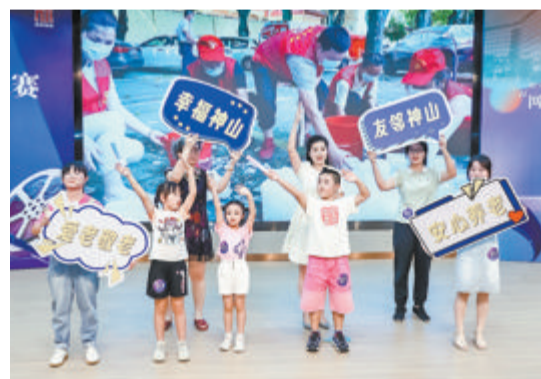
▲神山社区表演节目《殿前街道神山养老服务照料中心成长记》。