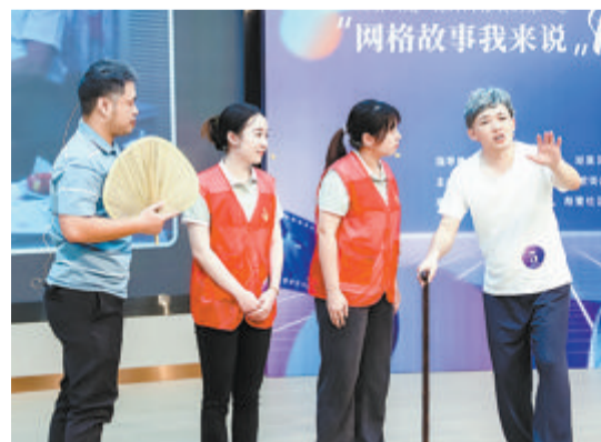
▲马垵社区表演节目《马垵社里的红色传承》。