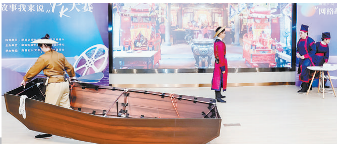
▲高殿社区表演节目《高崎古驿道的故事》。

城中村变身“城中景”,这在殿前街道并非只是舞台演绎的“剧本”,而是近年来的生动写照。在马垵社、中埔社等社区,治理已见成效,天空逐渐呈现“无线美”,而道路白改黑、绿化景观、口袋公园、活动广场、文体设施等公共服务配套设施正在逐步推动和落地,城中村的环境将迎来全面提升。