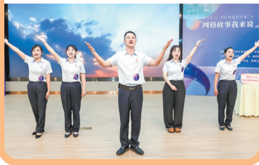
▲嘉福社区表演节目《穿越时空的对话》。