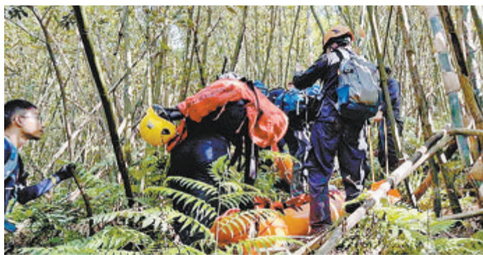
台湾一个登山团遇到蜂群攻击，新北市消防局获报前往救助。

据台湾媒体报道 20名台北、新北市民通过登山群组，20日早上相约到新北市瑞芳区八分寮步道健行，突遇上百只虎头蜂攻击，有11人遭蜇受轻、重伤，其中2人失去呼吸心跳，送医不治。新北市消防局获报前往救助，4名消防人员也被蜇伤。