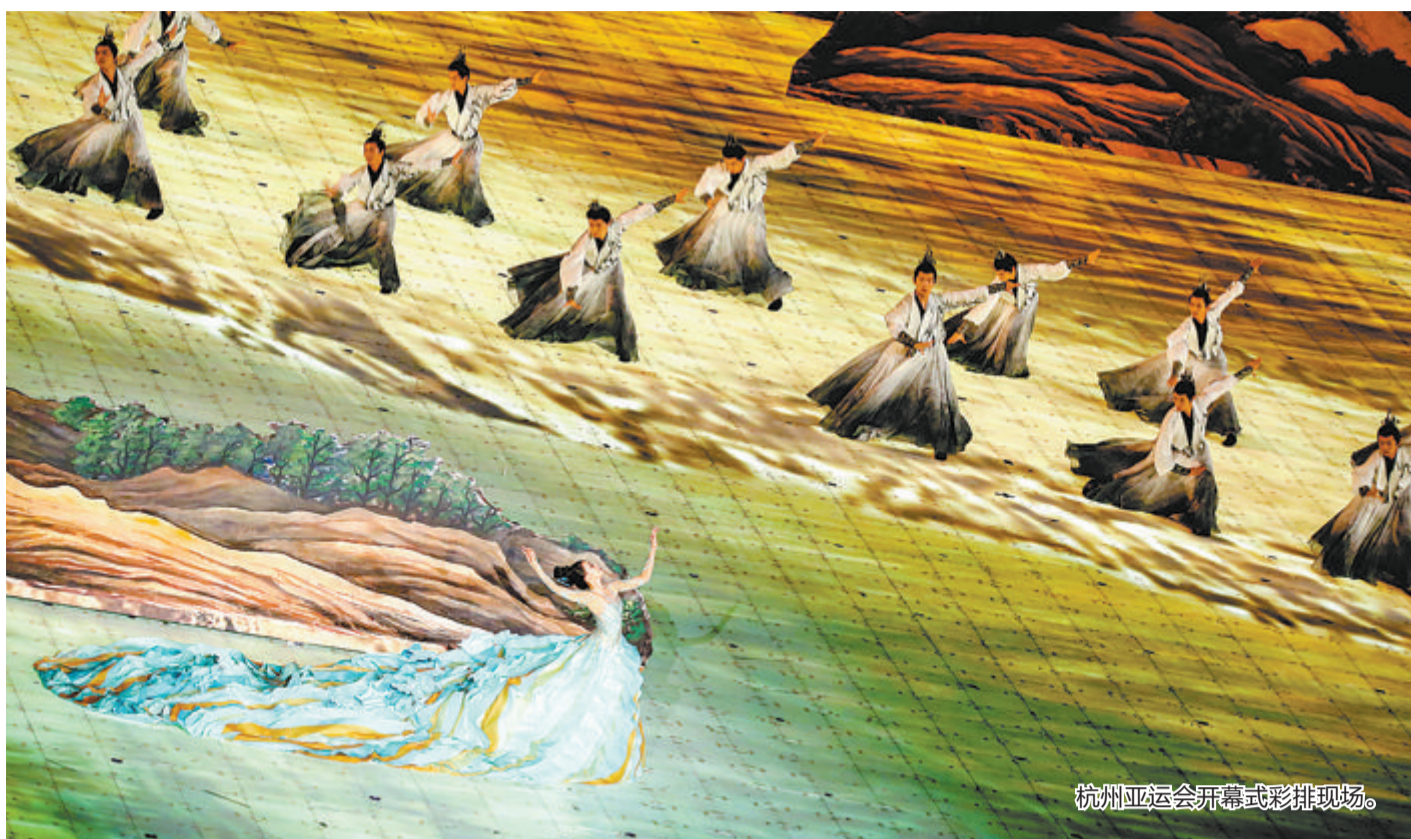
杭州亚运会开幕式彩排现场。