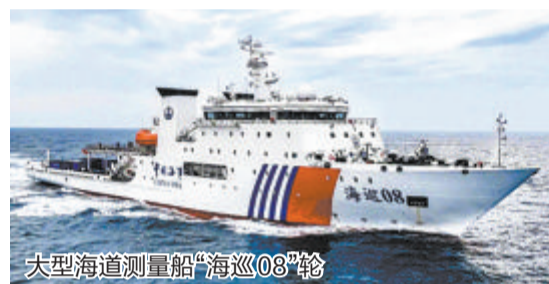
大型海道测量船“海巡08”轮

新华社上海9月21日电 21日，交通运输部海事局大型海道测量船“海巡08”轮在上海正式列编交通运输部东海航海保障中心，标志着我国海事系统目前规模最大、装备最先进、综合能力最强的大型专业测量船正式投入使用。