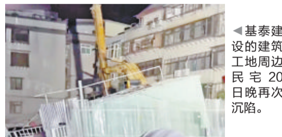
基泰建设的建筑工地周边民宅20日晚再次沉陷。

据中新网报道 台北市中山区大直街一处基泰建设的建筑工地，日前因施工不慎造成周边民宅受损害陷入地面。20日晚，该工地和周围民宅再次发生沉陷。对此，台北市副市长李四川21日表示：“周边25户民宅不断沉陷，每天的沉陷和倾斜大概是万分之六。”