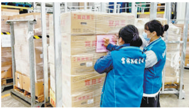
云林县卫生局查获一批冷冻杀菌液蛋，外箱标示原产地为台湾地区，后来确认是用进口鸡蛋制造。

据人民网报道 两家被查出用进口鸡蛋冒充本地鸡蛋的厂商20日喊冤，称是台当局农业部门要求标示产地为台湾地区。