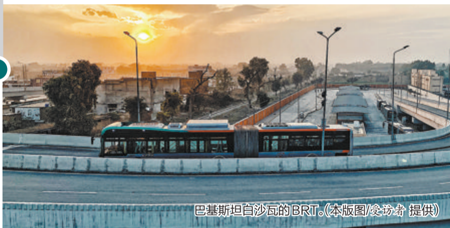
巴基斯坦白沙瓦的BRT。

我是2011年底从金旅客车的售后服务中心调到金旅海外销售公司。跨越山海，驰骋万里——这8个字，浓缩了我12年的海外市场开拓历程。作为海外销售人员，我深刻感受到共建“一带一路”的强大吸引力和旺盛生命力。