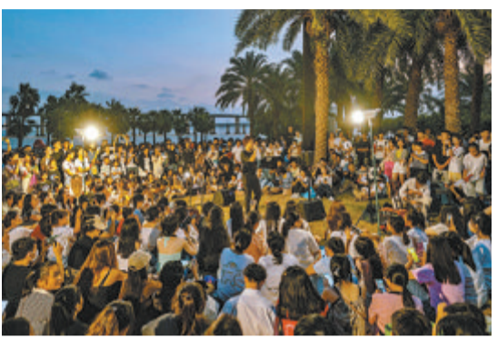
中秋国庆假期,十里长堤成为年轻人热门打卡点。

本报讯(记者 吴君宁)中秋国庆双节叠加,我市旅游市场人气火热,文旅新业态层出不穷。市文旅局昨日发布数据显示,中秋国庆假期,我市累计接待游客356.86万人次,实现旅游收入38.98亿元。