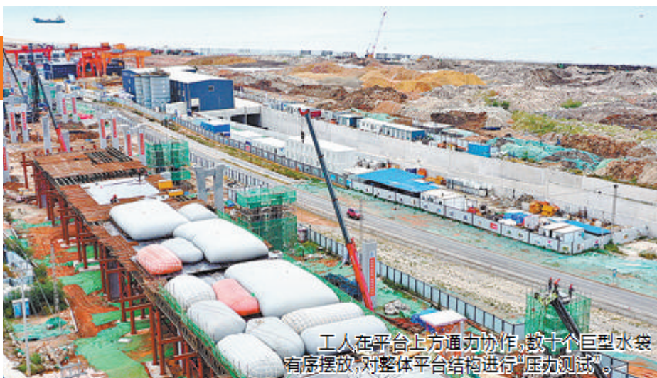
工人在平台上方通力协作，数十个巨型水袋有序摆放，对整体平台结构进行“压力测试”。

记者昨日获悉，厦门翔安机场配套重点交通项目——翔安机场快速路（大嶝岛段）工程B2标段现已展开桥梁上部结构施工。翔安机场快速路大嶝岛段全长6.4公里，分B1和B2两个标段建设，其中B2标段全长4.05公里，起点衔接B1标段主线高架，终于翔安机场进场段，因此该标段也被称为连接机场的“最后一公里”。翔安机场快速路全线（南、北、大嶝岛三段，总长度约10公里）将于2025年通车。本报记者 谢嘉迪 王协云 通讯员 元浩洁 摄影报道