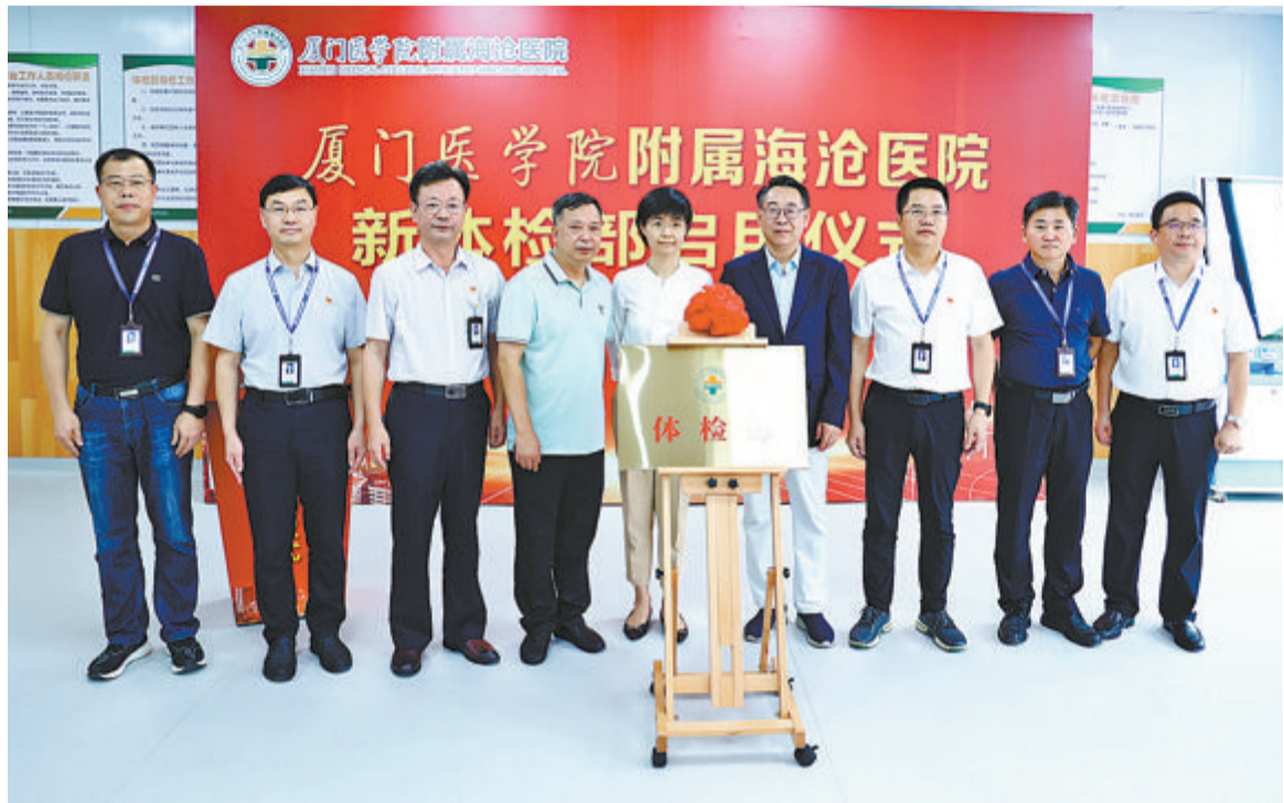
▲厦门医学院附属海沧医院升级改造后的体检部正式投入使用。