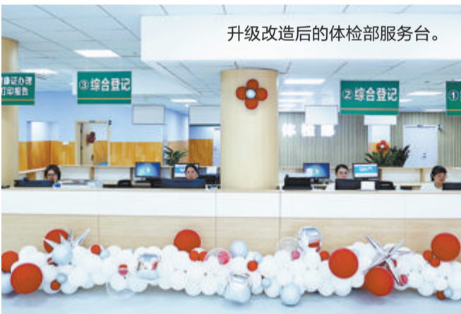
升级改造后的体检部服务台。