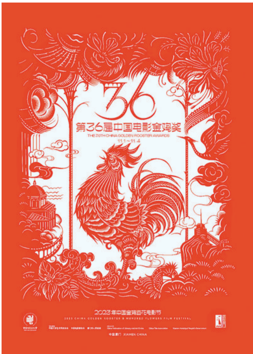
第36届中国电影金鸡奖主视觉海报

据了解，中国金鸡百花电影节暨中国电影金鸡奖颁奖典礼自2019年起连续十年长期在厦门举办。厦门落实“全城金鸡，全民金鸡”办节理念，策划了贯穿全年、覆盖全域的影视文化活动，今年以来共举办了30多项影展活动。