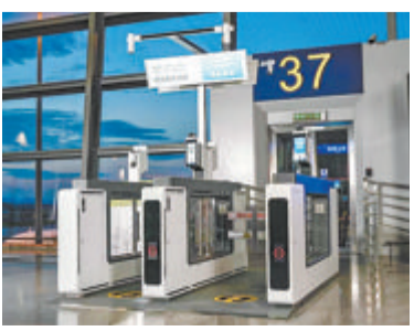
瑞为技术的智慧机场解决方案已覆盖国内众多机场。

单，排在第49位。 瑞为技术成立于2012年，致力于图像视觉感知技术的自主研发，是国家级专精特新“小巨人”企业、人工智能国家标准制修订单位。目前，瑞为技术的AI产品已在智慧机场、智慧商业、智慧园区等多个领域实现商业化应用落地。其中，瑞为技术的智慧机场解决方案实现了从值机、托运、安检到登机全流程覆盖，已服务大兴国际机场、浦东国际机场、萧山国际机场等众多机场。