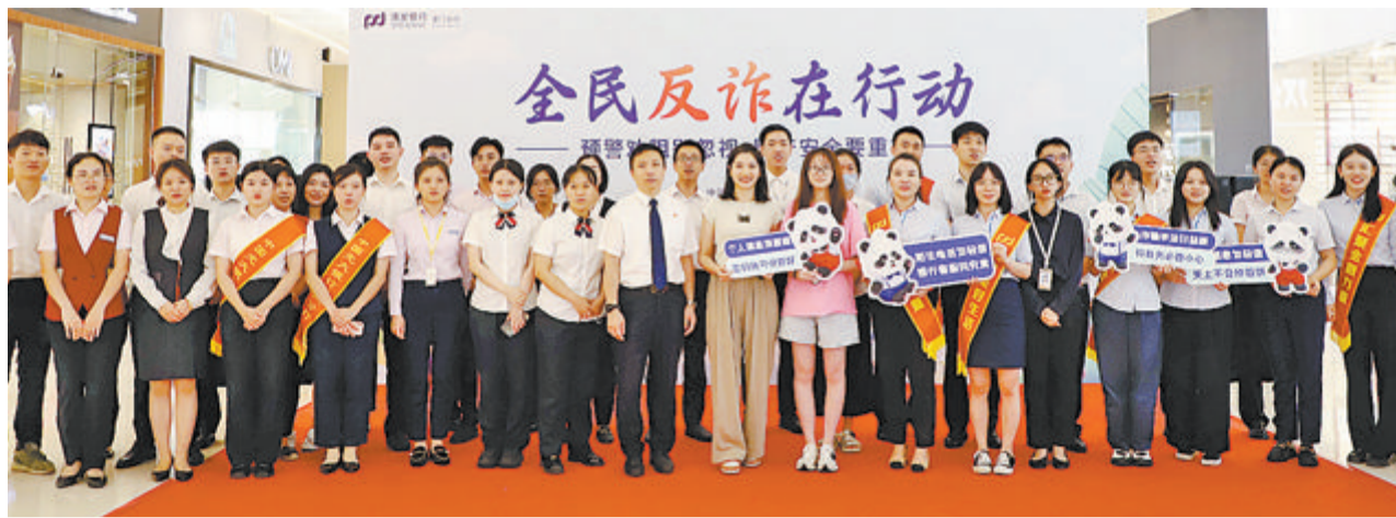
浦发银行厦门分行举办“全民反诈在行动”教育宣传活动。

文/本报记者 陈敏 严明君 线下教育宣传有诚意，线上金融知识传播有新意……浦发银行厦门分行将公众教育放在重要位置，多渠道、多形式开展金融知识教育宣传活动，覆盖老年人、学生和新市民等社会重点群