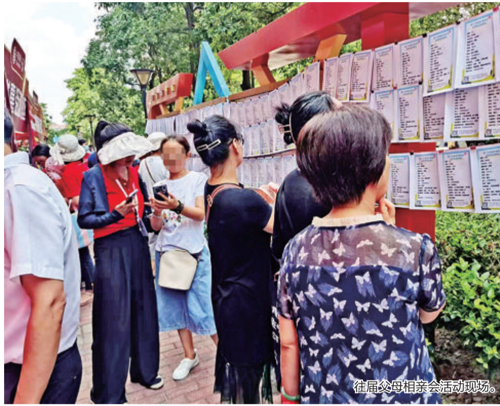
往届父母相亲会活动现场。