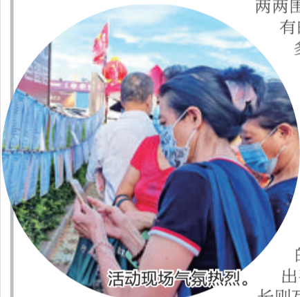
活动现场气氛热烈。