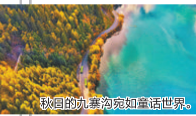
秋日的九寨沟宛如童话世界。

推荐线路: 四川成都、四姑娘山双桥沟、九寨沟红叶季双飞6日游 墨绿色的杉树、火红的枫林、金黄的秋叶、清澈的湖泊和海水,秋天的九寨沟仿佛让人走进了一场浪漫的秋天童话。黄龙的秋,则是一幅与生俱来的绝美画卷,秋日的