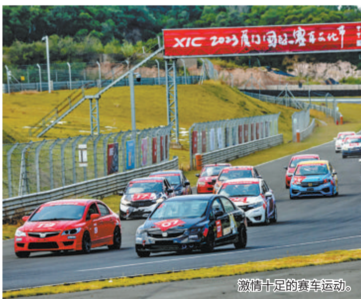
激情十足的赛车运动。

在“2023中国摩方机车文化节厦门站”“中国汽车流通协会摩托车分会骑行官认证”的活动中,探寻时下最受欢迎、最酷炫的摩托车品牌、车型和装备,近距离欣赏各种高难度的机车特技展示;在汽车文化生活展和静态主题车展,感知汽车改件和热门车型的完美融合;在“2023福建体彩嘉年华”、后备箱市集、潮玩美食区等主题展区,市民们还跟亲朋好友一起游园露营、收获惊喜。