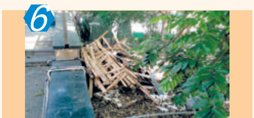
6 考评项目:大型商场周边 考评点位:湖里区万达广场 考评情况:该点位周边绿化带积存大量废弃物未及时处理,存在卫生死角;商场周边沿街店铺跨店经营现象较严重,物品乱堆放、非机动车乱停放、户外广告设置不合理等问题较多,考评成绩73.00分。