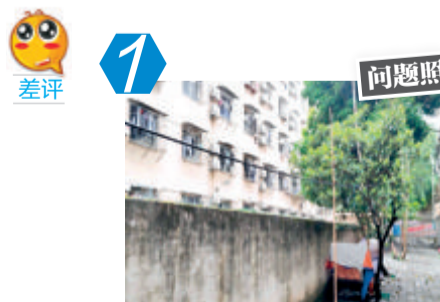
1 问题照 湖里区南山路101号 后侧乱拉绳索问题。经现场核查,该问题未整改。