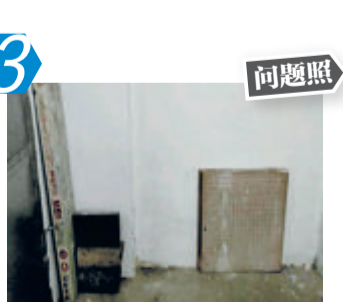
3 问题照 同安区东溪里3号 C114室对面建筑材料乱堆放 问题。经现场核查,该问题出 现回潮。