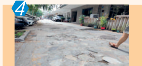
4 考评项目:背街小巷 考评点位:同安区芸溪路 考评情况:该点位部分路段地面破损严重;沿街道路卫生保洁清扫不到位,沿路绿化带积存较多垃圾杂物、存有卫生死角;沿街商家乱摆放、乱排放污水、乱设置户外水龙头和户外水池等问题较多,考评成绩82.00分。