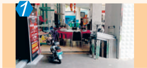
1 考评项目:城市社区(AB类) 考评点位:思明区前埔南社区 考评情况:该点位沿街商家跨店经营、物品乱堆杂、广告乱摆放问题较多,公共秩序较为杂乱;社区居委会周边垃圾落地、建筑垃圾堆积、边角积存废弃物等现象较突出,考评成绩80.00分。

9月份,市城管办组织对上个月考评通报问题和前期行业考评曝光问题进行“回头看”督察核查。其中,抽查核验上个月测评通报问题120件中,已整改115件,未整改或回潮5件,整改率95.8%。回访情况如下: