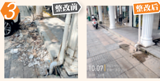
3 整改前 整改后 同安区双溪路477号建筑垃圾、渣土堆积问题。经现场核查,该问题已整改。