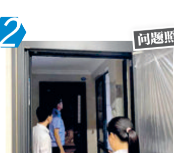
2 问题照 海沧区海投第一湾(新 景东里134号205室)违规搭 建阳光房问题。经现场核查, 该问题未整改。