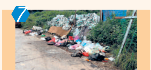
7 考评项目:农村生活垃圾治理和环境卫生管理(行业考评) 责任单位:同安区洪塘镇龙泉村 考评情况:该村村容村貌管理较差,房前屋后堆杂问题较突出,未及时清运或规整;边角地带大量垃圾和生活废弃物久积成堆,地面脏污,异味严重,考评综合成绩79.41分。