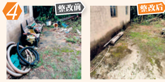
4 整改前 整改后 翔安区新圩镇云头村云头85-4号乱堆杂物问题。经现场核查,该问题已整改。