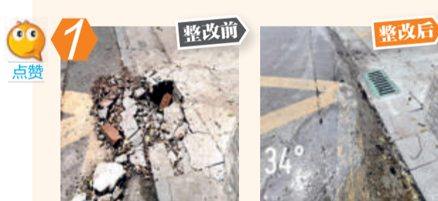
1 整改前 整改后 思明区文屏路202-4号人行道破损问题。经现场核查,该问题已整改。