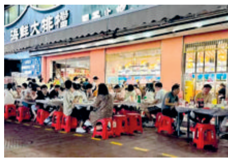
▲思明区在开元路积极探索“适当跨店经营+多元共治”新模式,推动特色街区市容环境、消费全面升级。

针对以上考评通报指出的问题和薄弱环节,希望全市各区、各部门积极行动起来,创新方式方法,将问题整改到位,把工作落实落细,全力配合做好创建全国文明城市工作。