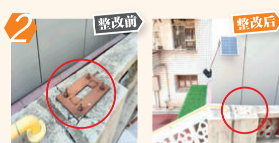
2 整改前 整改后 集美区嘉庚路16-3号1梯对面设施残留问题。经现场核查,该问题已整改。