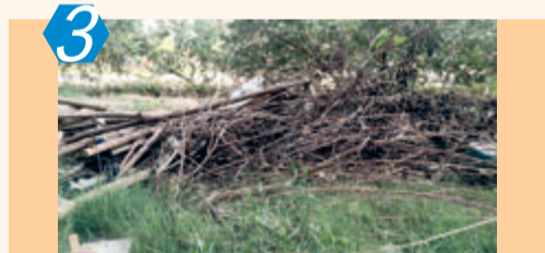
3 考评项目:小区 考评点位:海沧区水云湾小区 考评情况:该点位大量绿化垃圾长时间未清理;公共区域内存有垃圾落地、路面积水、建筑垃圾堆积等现象;小区内还存在物品堆杂、设施破损、公益广告褪色污损等问题,考评成绩74.00分。