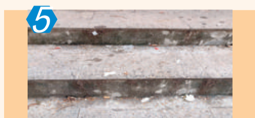
5 考评项目:农贸市场及周边 考评点位:翔安区翔安农贸市场周边 考评情况:该市场周边有行人乱扔垃圾、烟蒂,卫生清扫保洁不到位;沿街路段存在占道经营、乱停放、乱堆杂,乱排、乱倒污水、泔水等现象,考评成绩82.00分。