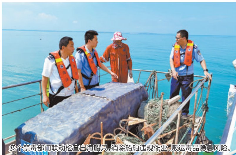
多个禁毒部门联动检查出海船只,消除船舶违规作业、贩运毒品隐患风险。

“这片是礁岛,与对面金门直线距离是1.8公里,这些在海上移动的标点,就是我们的渔船,船上的渔民常年在海上活动,也都是我们禁毒工作的‘信息员’。在沿海毒品查缉指挥中心‘三五’工程综合指挥室,翔安公安分局禁毒民警指着屏幕介绍。