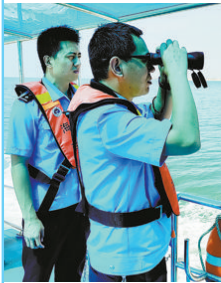
▲禁毒部门实时紧盯海域动态。

从其他海防工作来看,2021年至今,翔安区沿海破获偷私渡案件21起,查获21人,分别同比前三年下降25%、34.38%,且该类案件均与涉毒案件无关。值得一提的是,全区近年来污水毒品成份检测结果以低数值、低风险且位居全省前列,毒情管控形势持续企稳向好,毒品治理体系日臻完善。