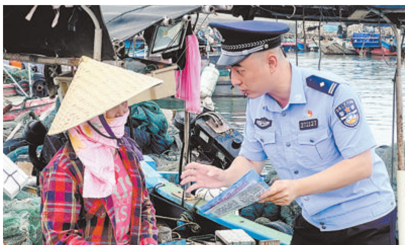
▲禁毒部门开展禁毒、平安海域等相关宣传。

“枫桥经验”的精髓在于发动群众参与社会治理,我们翔安的大嶼岛、小嶼岛、角屿三个岛屿被称为‘英雄三岛’,在二十世纪五十年代,军民一心,守护海防前沿阵地。如今,这里的老百姓也是我们禁毒人民战争的重要力量。”翔安区禁毒办相关负责人介绍。