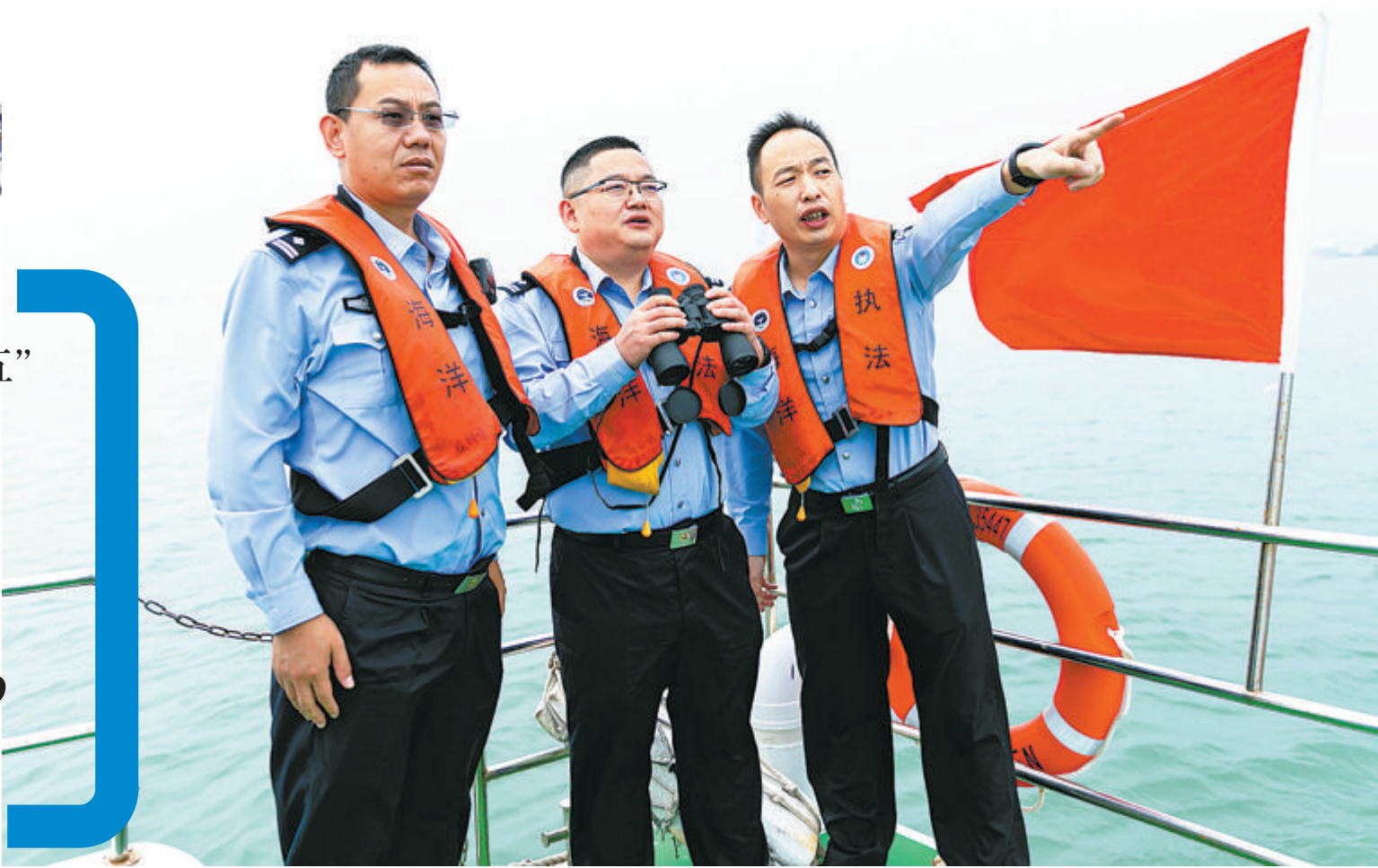
▲禁毒部门强化海上巡逻常态化,筑牢沿海毒品查控铜墙铁壁。