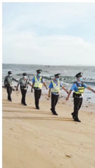
▲在运用科技手段的同时,翔安区禁毒部门还强化海岸线的巡逻,用扎实的“铁脚板”,走出海域管控“平安路”。

独特的区位优势,决定了防范潜在毒品犯罪的特殊使命。为严厉打击、有效预防涉海毒品犯罪活动,近年来,翔安区禁毒部门立足区位优势,坚决贯彻落实中央、省、市禁毒机关关于禁毒工作的部署,创新打造“五道防线合围”“五个系统融合”“五个部门联动”的沿海毒品查缉“三五”工程,将禁毒工作“海上查”与“岸线防”并重,把打击整治与生态治理结合,涉海毒品犯罪案件连续三年“零发生”,筑牢沿海毒品查控铜墙铁壁,在全国涉海毒品打击查控方面走出厦门新路径。