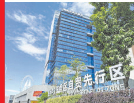
海丝中央法务区自贸先行区。(资料图)

(厦门)代表处、中国海事仲裁委员会“海上丝路仲裁中心”、中国国际经济贸易仲裁委员会与海峡两岸仲裁中心厦门庭审中心开展实质运营、办理案件;推动香港国际仲裁中心、香港海事仲裁协会、新加坡国际仲裁中心、新加坡海事仲裁院等头部仲裁机构与国际法务运营平台开展业务合作;鼓励引导盈科国际、安杰世泽、北京隆安等头部律所为企业“出海”服务……自贸先行区立足厦门,着眼全球,将国际化的理念融入片区建设中,推动更高水平国际化法律服务要素集聚,并深度融入更高水平开放型经济发展和“一带一路”建设,为企业“走出去”保驾护航。