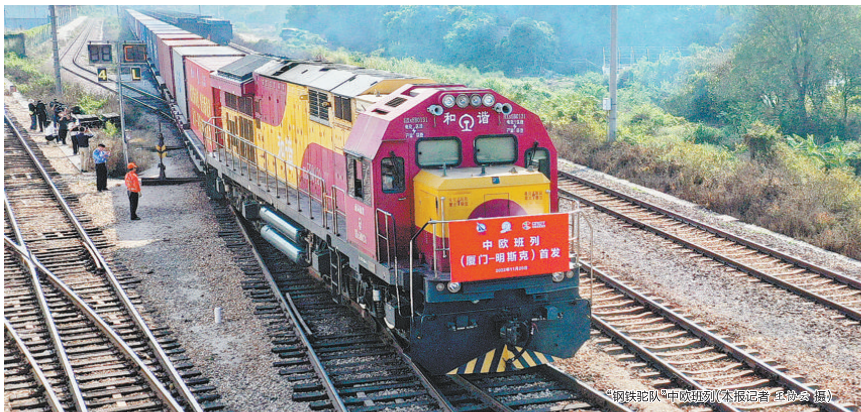
“钢铁驼队”中欧班列